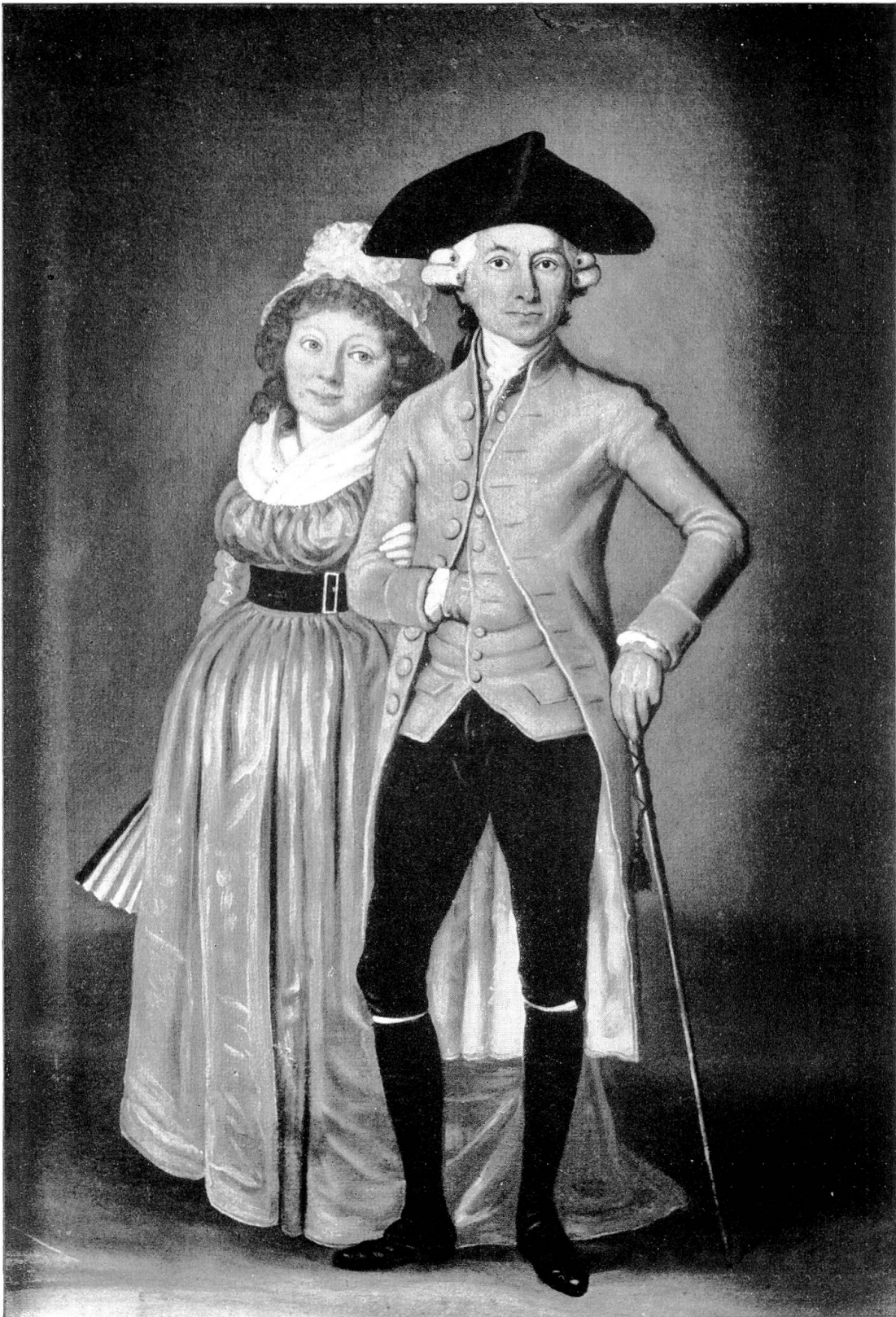
Reinhart. Bildnis des Vaters Meyer.