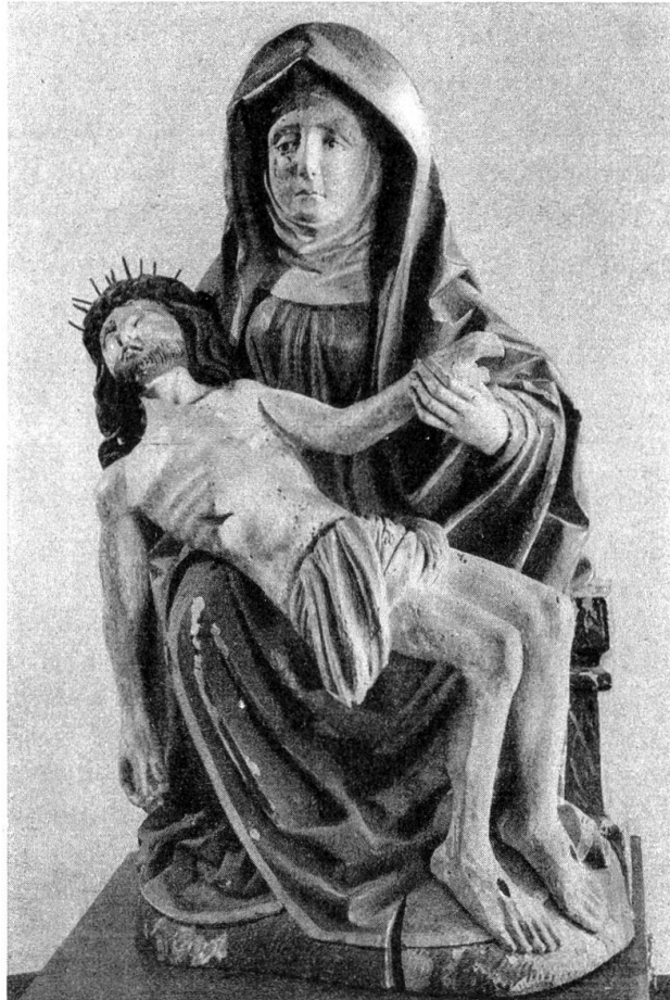
Vesperbild aus Freiburg. 16. Jahrh. 2. Hälfte.

des Museums zur Schau gestellten Wandgemälde aus der Frühzeit des 14. Jahrhunderts sind einer eigenen Würdigung vorbehalten. Sie gehören zu den in der Schweiz so überaus seltenen Profandarstellungen der mittelalterlichen Wandmalereien.