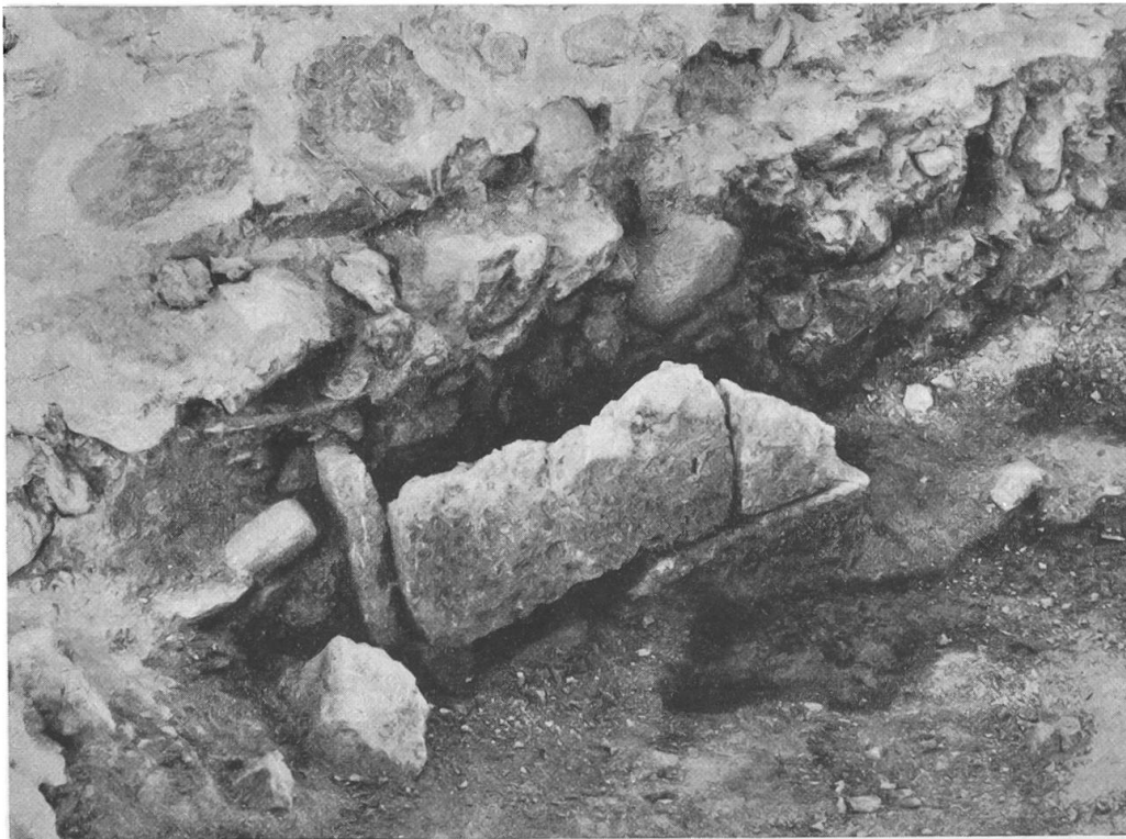
Abb. 12. Spiez.

Weiteres Skelettgrab der Völkerwanderungszeit im südlichen Seitenschiff der Basilika. Das Grab, in ca. 2 m Entfernung vom Reitergrab, lehnt sich an die Fundamente der Aussenmauer.