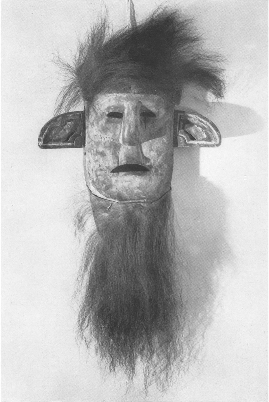
Taf. II. Maske der Toba Batak, Sumatra. (Leihgabe E. von der Heydt im Bernischen Historischen Museum.)