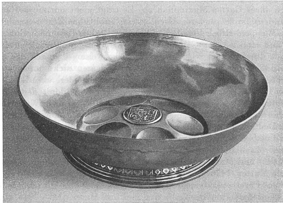
Abb. 26. Silbervergoldete Schale mit österreichisch-burgundischem Wappen, letztes Viertel des 15. Jahrh. Text S. 92.

Die Schale, deren Entstehung zwischen 1478 und 1504 (zwischen Geburt und Königschaft) angenommen war, rückt nunmehr in ihrem Ursprung zurück auf die Jahre ab 1476/77 bis wahrscheinlich nur 1494/97. War sie als Verlobungs- (1476), war sie als Hochzeitsgeschenk (1477) für Maximilian und Maria gedacht? Im ersten Falle könnte sie nach der Schlacht um Nancy 1477 einem Schweizer als Beute in die Hände gefallen sein. Sonst, d. h. als Besitz des verheirateten Maximilian oder aber der Maria, des Knaben Philipp oder der kleinen Margarethe wurde sie vielleicht Kampfpfeis in der Schlacht von Dornach 1499.