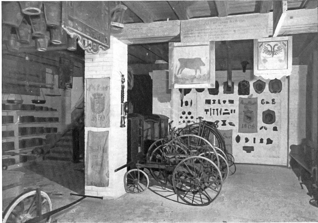
Umgestaltung des Untergeschosses 1956. Oben: Ausstellung Speis und Trank. Unten: Gleicher Raum im bisherigen Zustand.