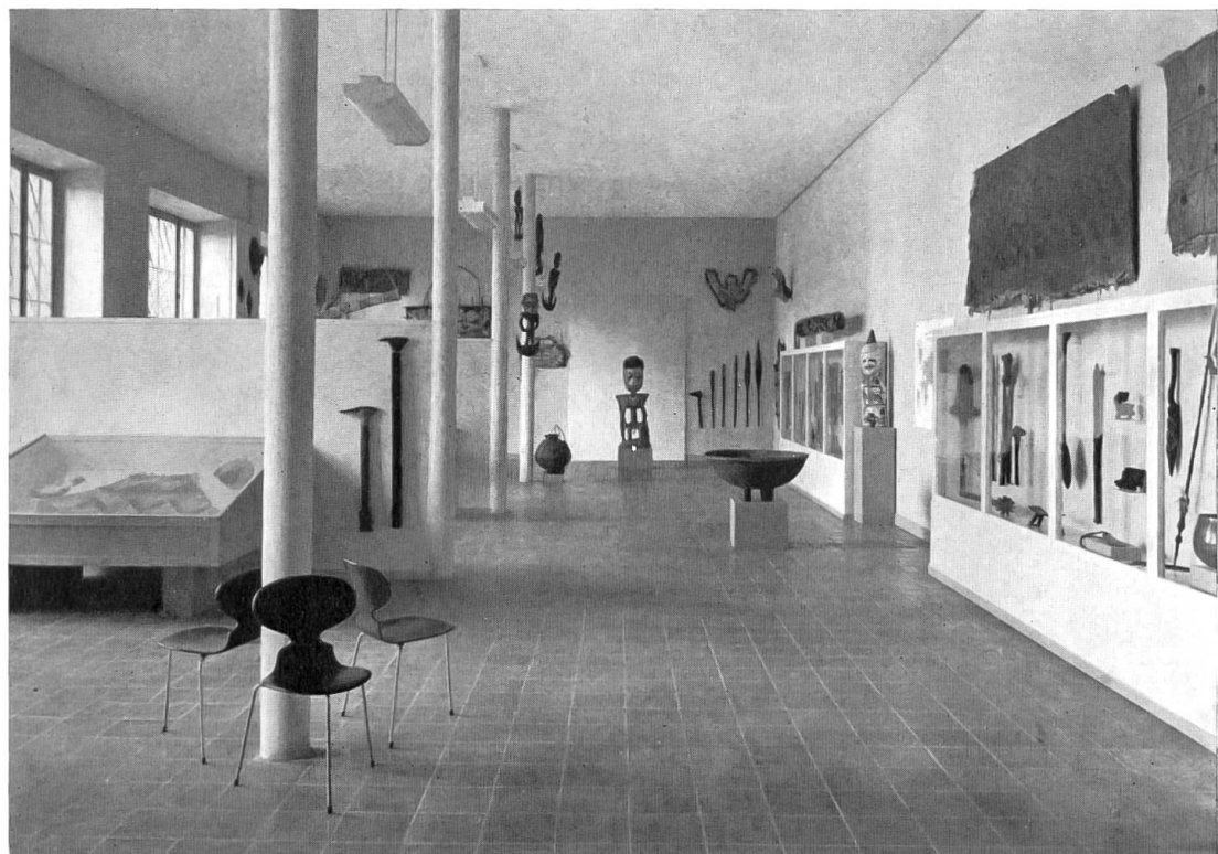
Neueinrichtungen. Oben: Blick in den Saal mit Sammlungsgegenständen der Völkerwanderungszeit, der gallo-römischen und keltischen Periode. Unten: Temporäre Ausstellung der Südsee-Sammlung.