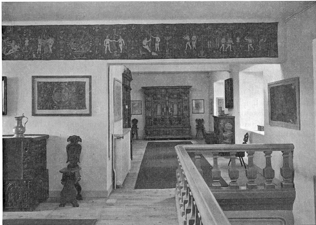
Neueinrichtung 1956: Vorraum zu den Alten Stuben.

Zwei hauptsächliche Maßnahmen ermöglichten den Verzicht auf einen äußern Erweiterungsbau und also die Beschränkung auf das alte Gebäude am Helvetiaplatz. Die großen Höhen des Altbaues erlaubten die horizontale Unterteilung einzelner Säle durch Einbau von Zwischenböden und damit die Unterbringung von Studiensammlungen für Keramik, ur- und frühgeschichtliche Sammlungen, Völkerkunde. Dies bewirkte die Entlastung der Schau-sammlungen, ließ sie übersichtlich, heiter, anschaulich werden. Das gezeigte Material sieht einprägsamer aus, kostbar und schön; seine ästhetische und lehrhafte Auswirkung auf junges und erwachsenes Publikum ist um vieles vermehrt.