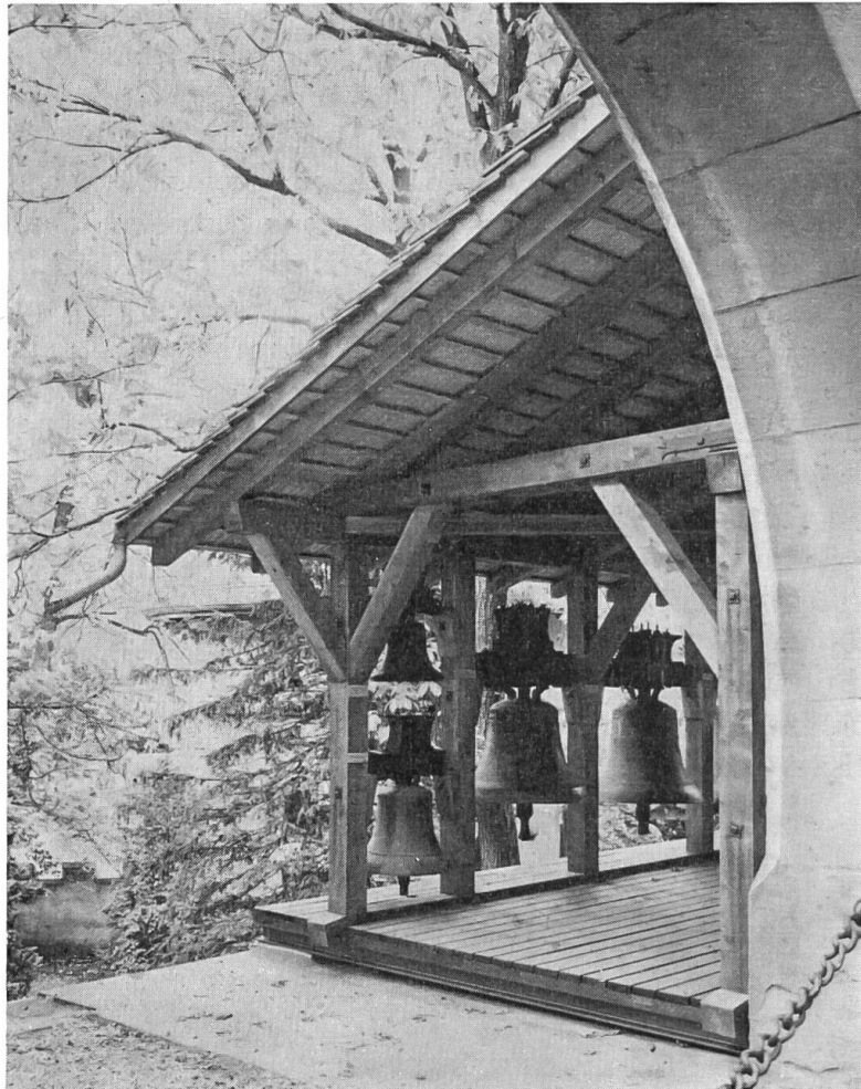
Neueinrichtung 1956: Glockenstuhl.

Bevor 1949 die Erneuerung in Angriff genommen wurde, stellte sich die grundsätzliche Frage, ob angesichts der vorhandenen Platznot, in der das im Bestand stets wachsende Museum stak, alle Kräfte sich auf die Verwirklichung eines Erweiterungsbaues richten sollten, für den, von der Kommission genehmigt, bereits ein umfangreiches Projekt vorlag. Die anderweitigen dringlichen Bauaufgaben, die sich damals und fürderhin den drei Kontrahenten