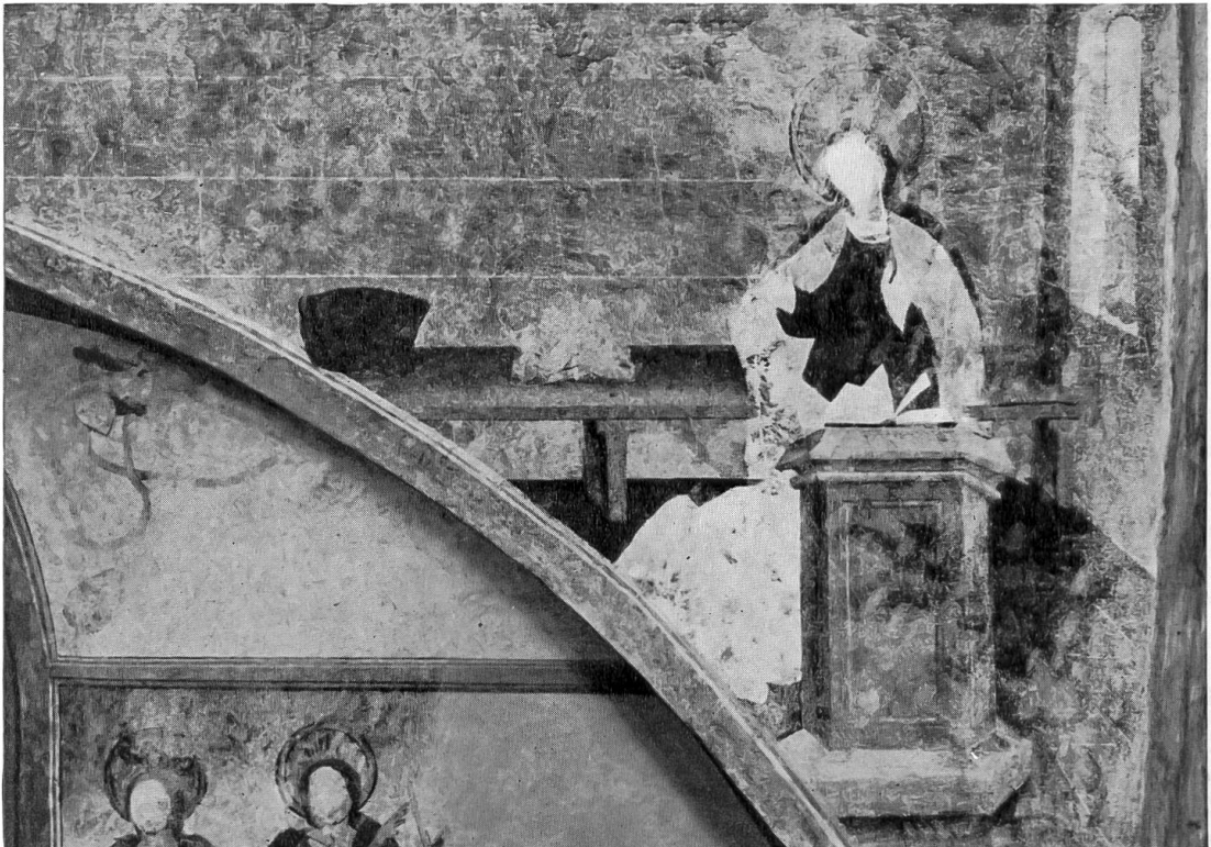
Schloß Oberhofen. Oben: Freilegung des Burgraums im Erdgeschoß des Palas 1956. Unten: Freilegung von Wandmalereien in der Schloßkapelle 1956. Mariae Verkündigung (letztes Viertel 15. Jahrh.).