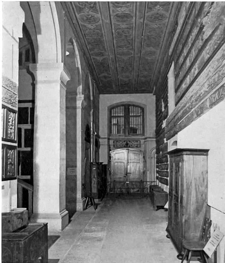
Umgestaltung des Untergeschosses 1956. Oben: Blick in die Halle. Ausstellung von Metallarbeiten. Unten: Bisheriger Zustand.