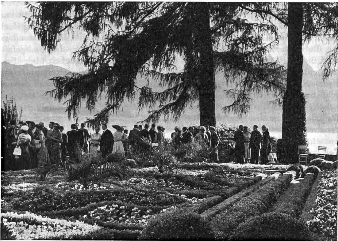
Schloß Oberhofen. Empfang des Diplomatischen Corps durch den Bundespräsidenten am 30. Juni 1956.