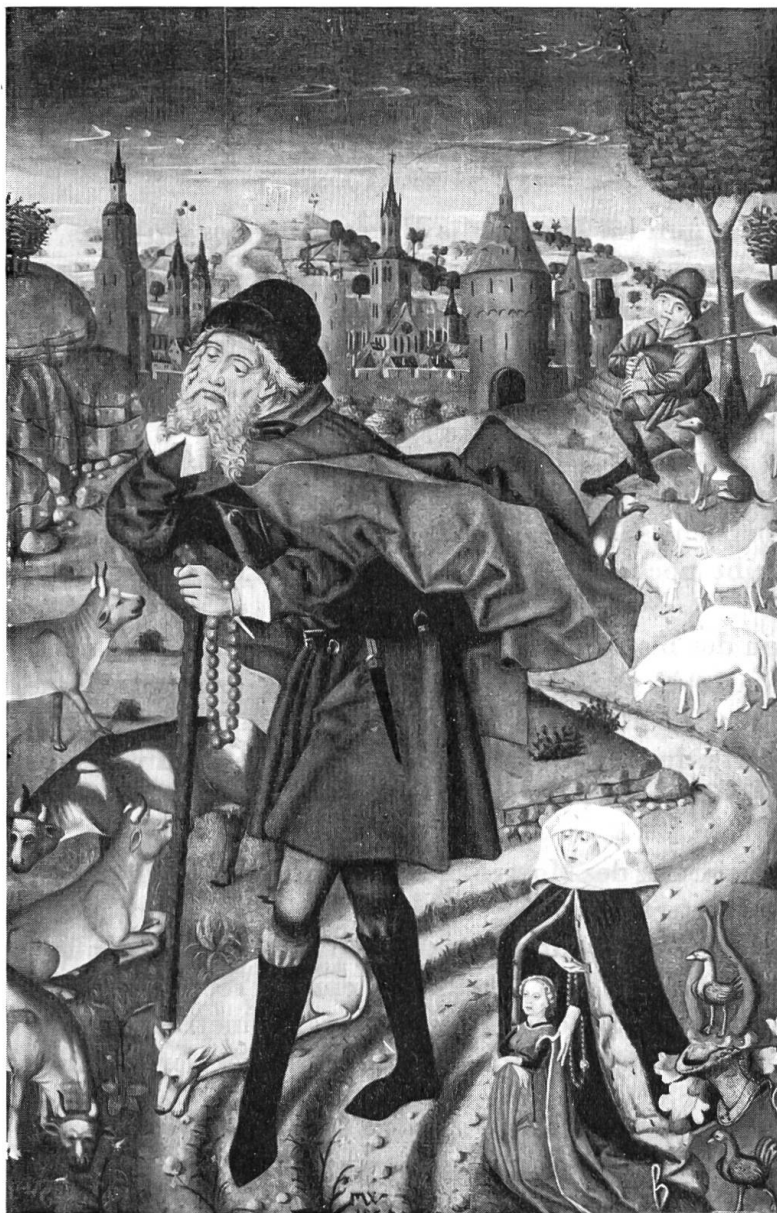
Friedrich Walther, Hl. Wendelin 1476. Restaurierung durch H. Howald 1956 (vgl. Taf. gegenüber).

Die Glocken kamen in einem glockenstuhlartigen, offenen hölzernen Anbau an der Außenseite des Museums zur Aufhängung. Sie wurden so gewissermaßen ihrem Element, der Luft, zurückgegeben (Abb. S. 10).