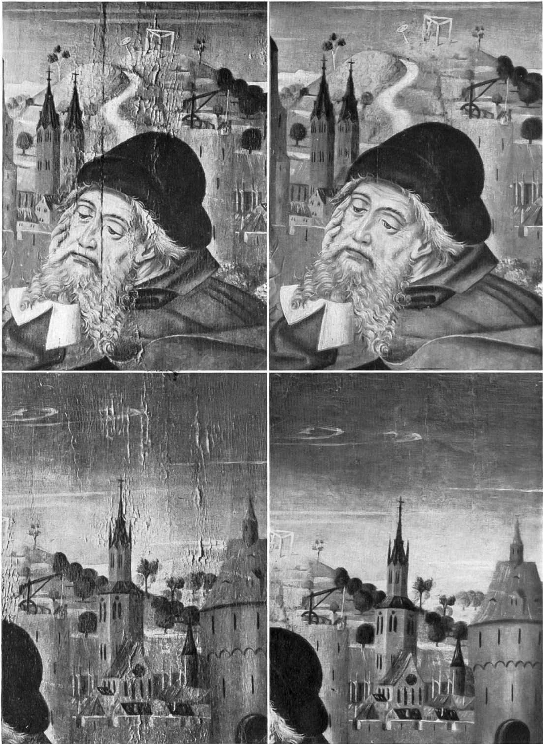
Friedrich Walther, Hl. Wendelin 1476, Ausschnitte. Links: Bisheriger Zustand. Rechts: Restaurierung durch H. Howald 1956 (vgl. Abb. gegenüber).