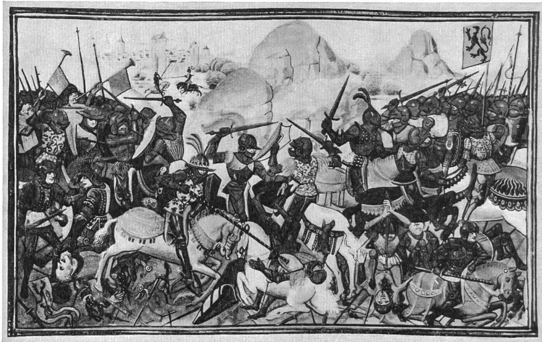
Abb. 30. Darstellung einer Schlacht aus «L'histoire de Charles Martel». Miniatur von Loyset Liédet (ms. 9, fol. 416v, B.B.R.).

Die Beziehung zwischen Teppich und Miniatur besteht zur Hauptsache im Figürlichen. Wir finden dieselben schlanken Figuren mit der engen Taille, mit den dünnen, langen Beinen, der leicht steifen, etwas ungelenkten Körperhaltung. Auch in den Rüstungen und Kostümen lassen sich Analogien finden. Dies dürfen wir zwar nicht als maßgebendes Charakteristikum betrachten,