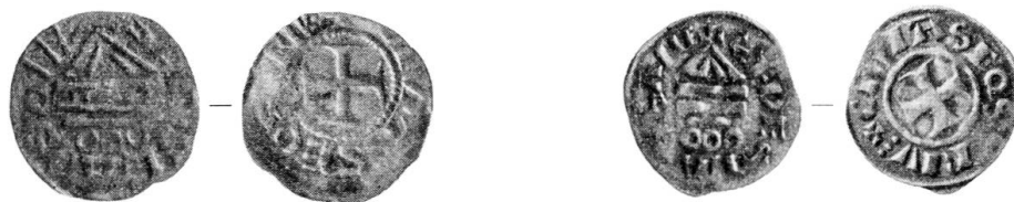
Abb. 5. Lausanner Denare