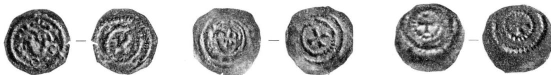
Abb. 4. Solothurner Pfennige