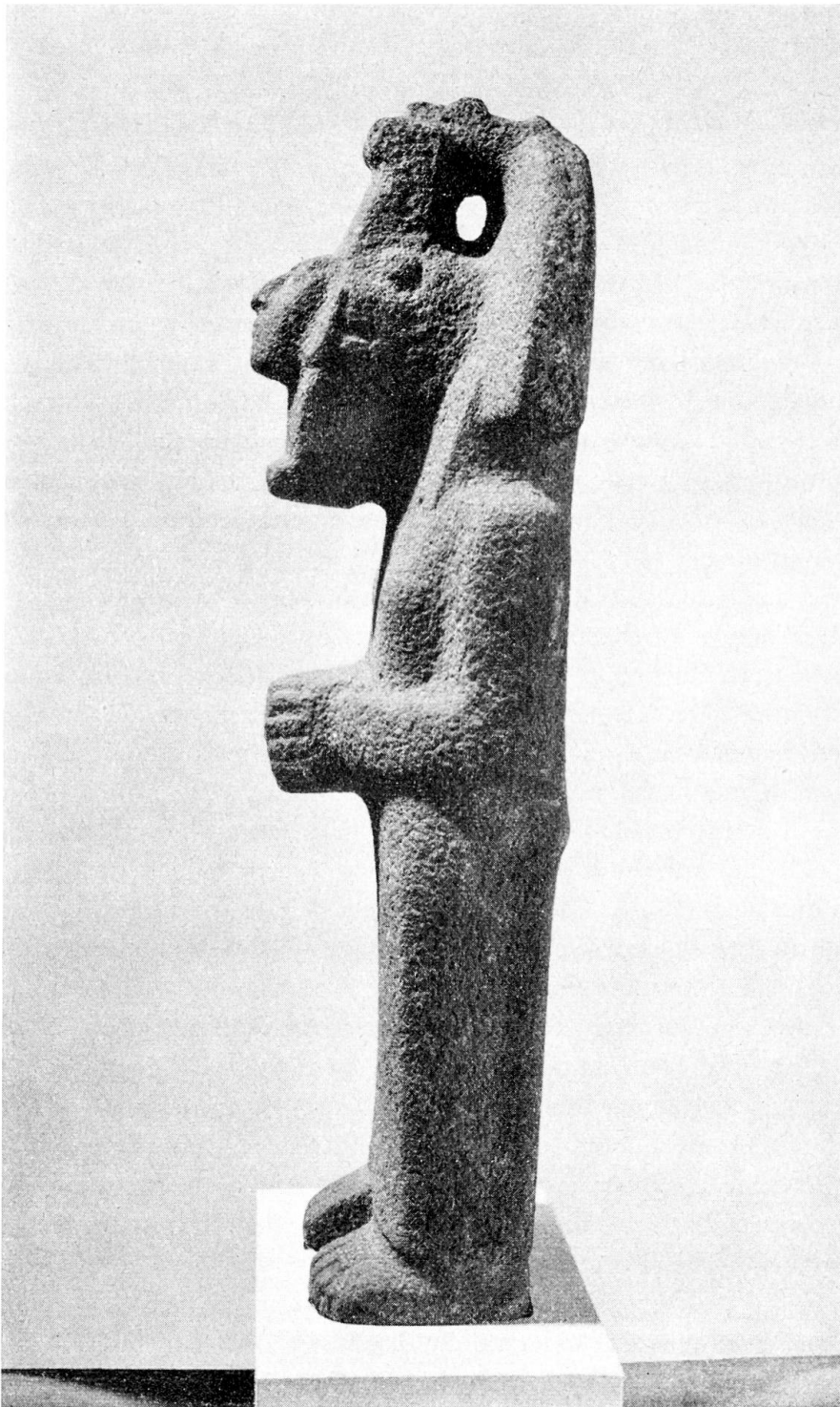
Abb. 1. Statue aus grauem Sandstein, Seitenansicht. Mexiko, Huastekisch, 9./10. Jahrh. H. 71 cm (Inv.-Nr. Mex 1553)