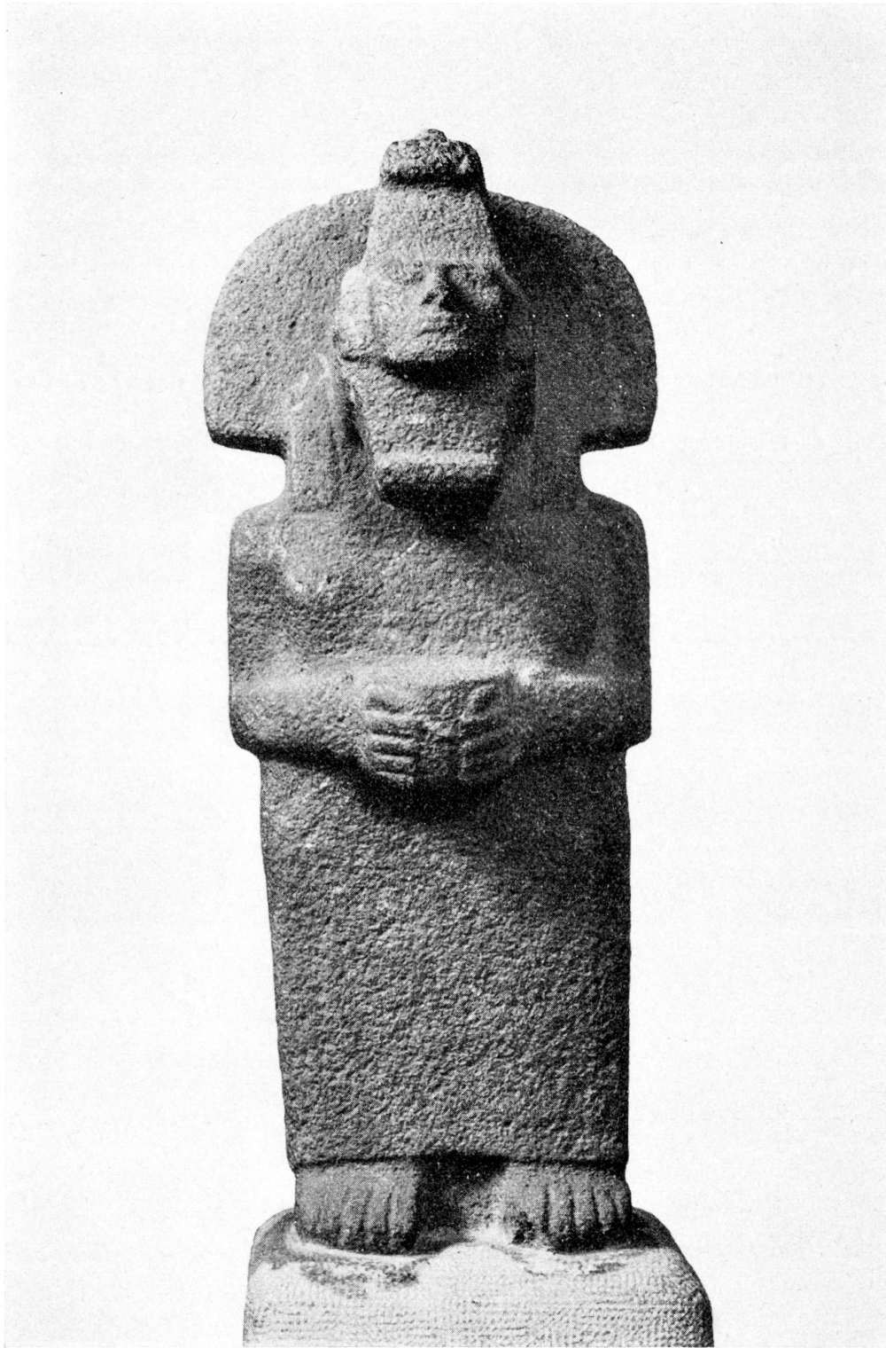
Abb. 2. Statue aus grauem Sandstein, Vorderansicht. Mexiko, Huastekisch, 9./10. Jahrh. H. 71 cm (Inv.-Nr. Mex 1553)