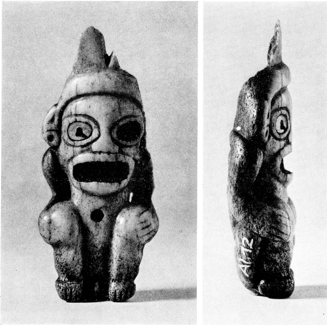
Abb. 4/5. Figur aus Walroßzahn, Vorder- und Seitenansicht. Alaska. H. 10 cm (Inv.-Nr. Al 12)

n. Chr. entstanden ist 1 . Sie stellt eine hockende, nackte männliche Gestalt dar. Der Körper ist in knapper, zylindrischer Form gegeben, die Arme und Beine entwickeln sich aus ihm in wenigen, kaum von ihm gelösten Umrissen. Eine mit schwarzer Masse gefüllte, und einst vielleicht mit einer Einlage versehene runde Eintiefung im Leib bezeichnet den Nabel. Das überaus mächtige Haupt wächst ohne Hals direkt aus der Schulter. Das Gesicht ist auffallend flach gebildet, die Nase nur durch Umrisslinien wiedergegeben, das eine noch erhaltene Ohr in fast ornamentaler Spiralförmigkeit dargestellt. Mund und Augen erscheinen als riesige Ovale mit doppelten