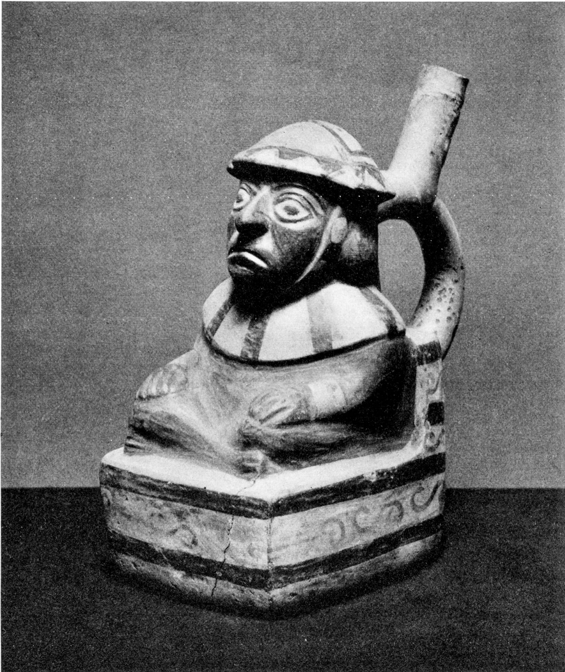
Abb. 3. Figürliches Tongefäß. Peru, Mochica-Kultur, 4./5. Jahrh. H. 21,4 cm (Inv.-Nr. Pe 213)

metaphysischen Mächte, gewährleistete erst den Bestand des Weltganzen und damit auch die Existenz des Menschen.