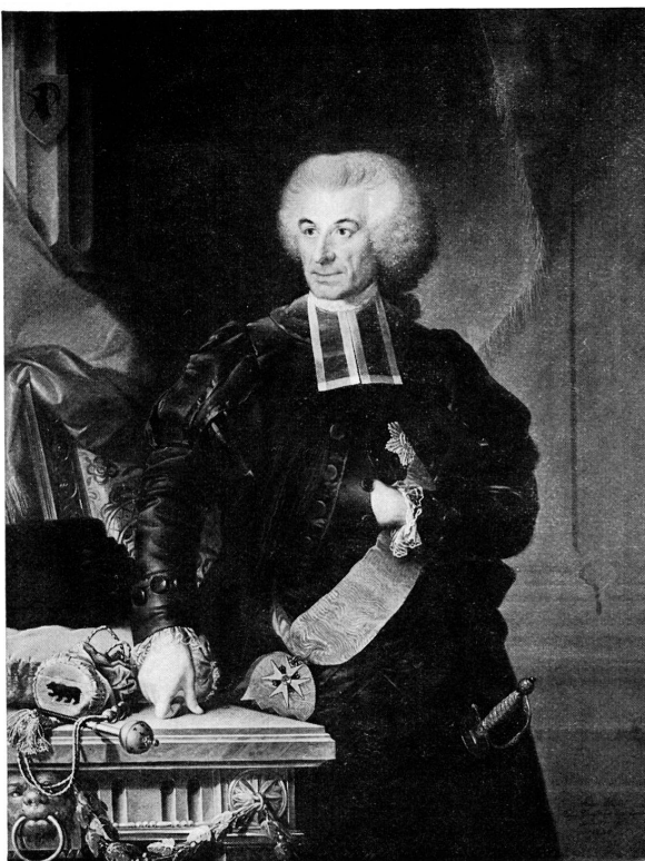
Abb. 3. Anton Hickel, 1787 (Stadtbibliothek Bern)