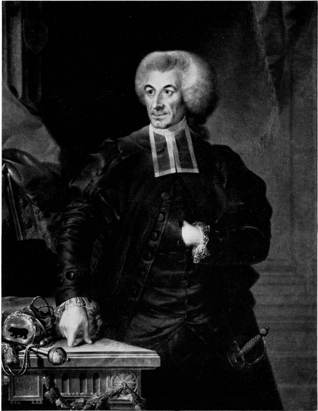
Abb. 1. Anton Hickel, 1787 (Bernisches Historisches Museum)