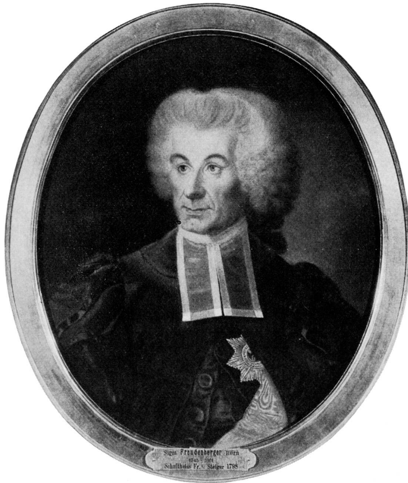
Abb. 5. Sigmund Freudenberger, Zuschreibung, Pastell, Kat.-Nr. 1 (Kunstmuseum Bern)