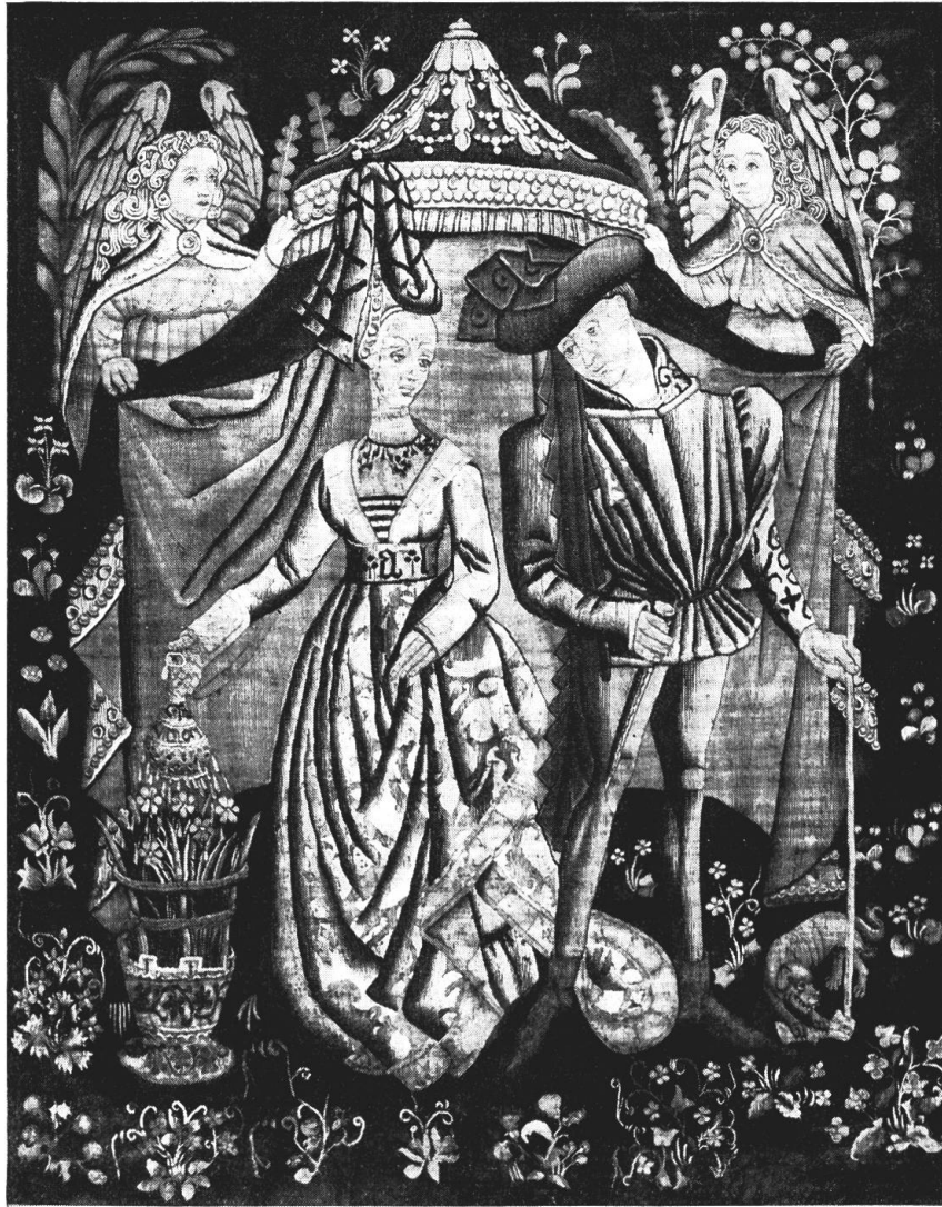
Abb. 89. Louis I er de Savoie und Anne de Lusignan. Wandteppich. Um 1450 Paris, Musée des Arts Décoratifs

Ein fürstliches Paar in Lebensgröße vor einem zeltartigen Baldachin! Ohne daß ein triftiger Grund angegeben werden könnte, gelten die Dargestellten für Charles d'Orléans und seine dritte Gemahlin Maria von Cleve. Die Buchstaben «a . l»