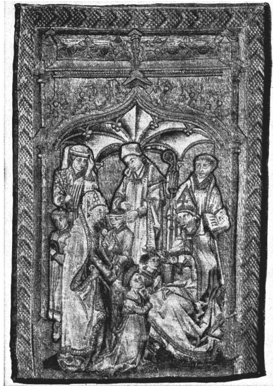
Abb. 90. «Firmung», Detail aus den Stäben eines Chormantels für Jacques de Savoie, Comte de Romont. Stickerei, um 1460/1476. Bernisches Historisches Museum

auf dem Gürtel der Dame darf man aber als ihre Initialen ansehen, weshalb wir sie mit Anne de Lusignan identifizieren möchten. Der Teppich, der, wie wiederholt bemerkt wurde, in manchem unserm Traian-Herkinbald-Teppich nahesteht — man vergleiche den Hund mit jenem in der linken untern Ecke unsres Teppichs, die eingestreuten Pflanzen, die perlenbesetzten Zierborten — nehmen wir daher ebenfalls für Tournai in Anspruch 293 . Er könnte zu dem bedeutenden Bestand an Teppichen gehört haben, den das Haus Savoyen besessen hat 294 .