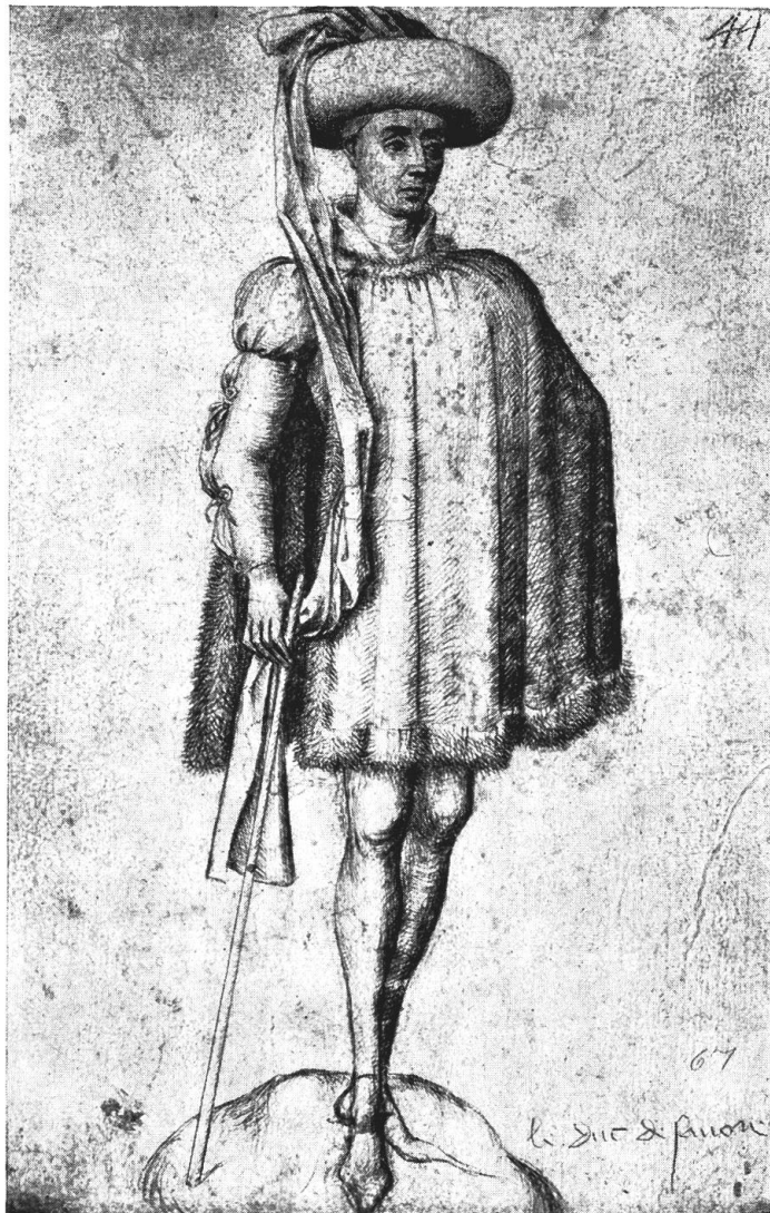
Abb. 88. Rogier van der Weyden (?), «le duc de savoie» (Louis I er de Savoie). Silberstiftzeichnung Rotterdam, Museum Boymans-van Beuningen

seines Herzogs Vetter nicht nach einem Bilde, sondern nach dem lebenden Modell aufnahm, sei es anlässlich eines Aufenthaltes des Savoyers in Brüssel, sei es, daß Rogier selber den savoyischen Hof aufgesucht hat.