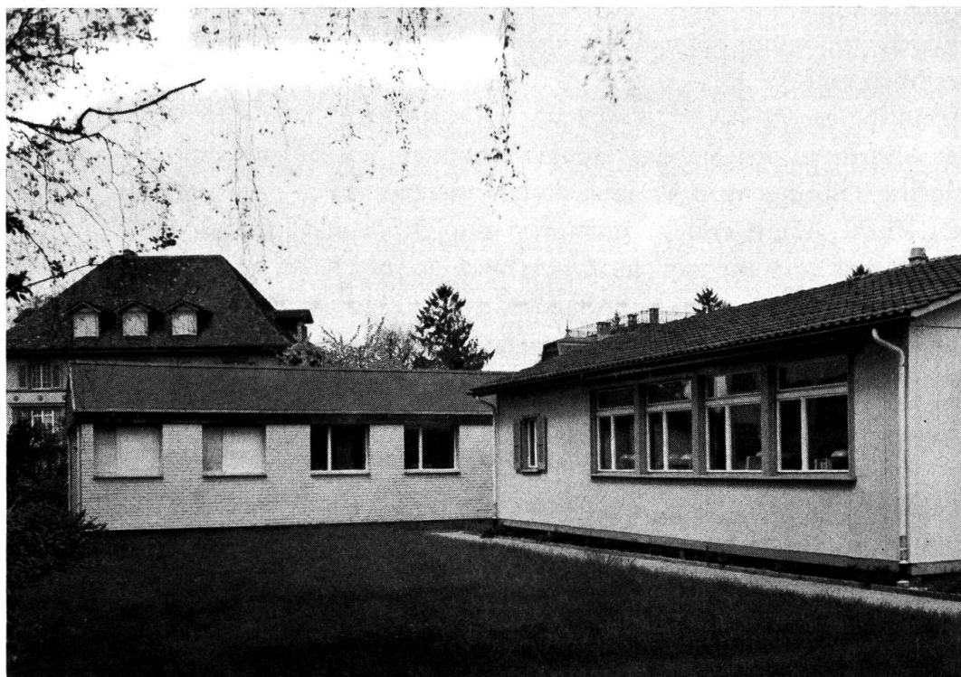
Abb. 1. Die beiden neuerstellten Baracken; links der «Pavillon» mit Arbeitsräumen für das Museum, rechts das Seminar für Ur- und Frühgeschichte der Universität Bern

Mangels geeigneter Arbeitsräume im Hauptgebäude selbst, konnte 1965 dank einem von Seiten der Partizipanten zugesprochenen Sonderkredit Herrn Architekt A. F. Bürki, Bern, der Auftrag für die Errichtung einer Baracke, genannt Pavillon ,