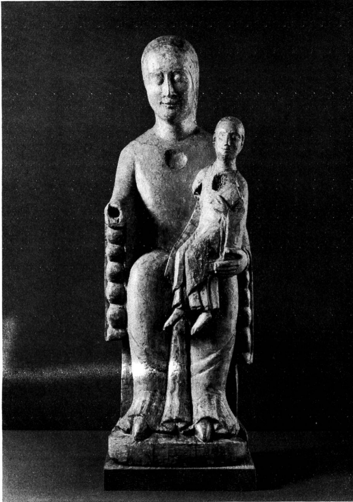
Abb. 4. Muttergottes aus Habschwanden, um 1200. Nach der Restauration

sind zurzeit noch nicht abgeschlossen. Neben kleineren Arbeiten an einem Rücklaken, einer Batik und einem Kaschmirschal wurden eine gestickte Tischdecke (Inv.-Nr. 26759) und ein Taufkleidchen (Inv.-Nr. 39184) konserviert.