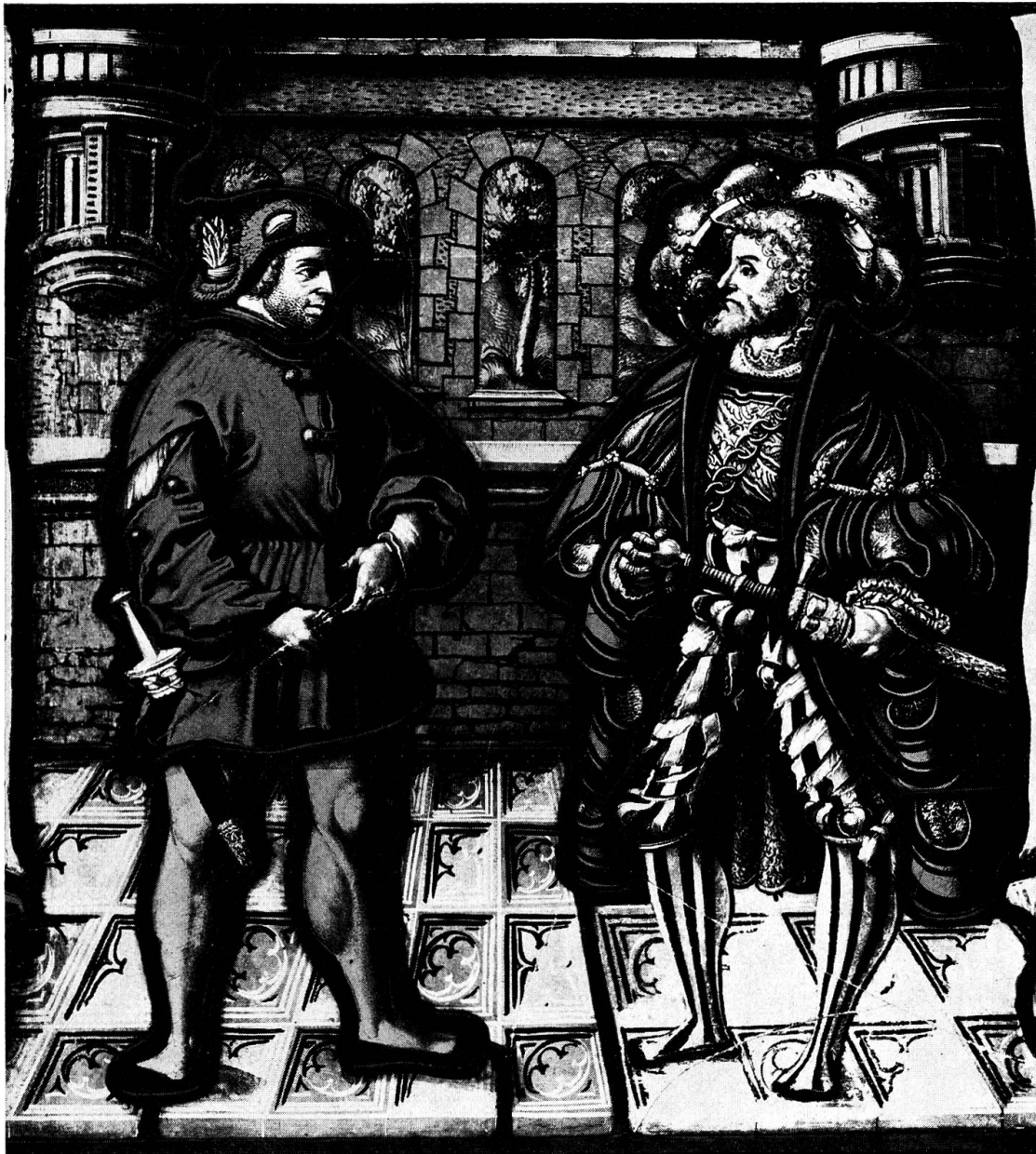
Abb. 2. Unterredung zwischen dem «alten und jungen Eidgenossen» (Detail Hauptbild)

post quem 1532 und infolge Wegzugs des Glasmalers der Terminus ante quem 1539 feststehen 18 .