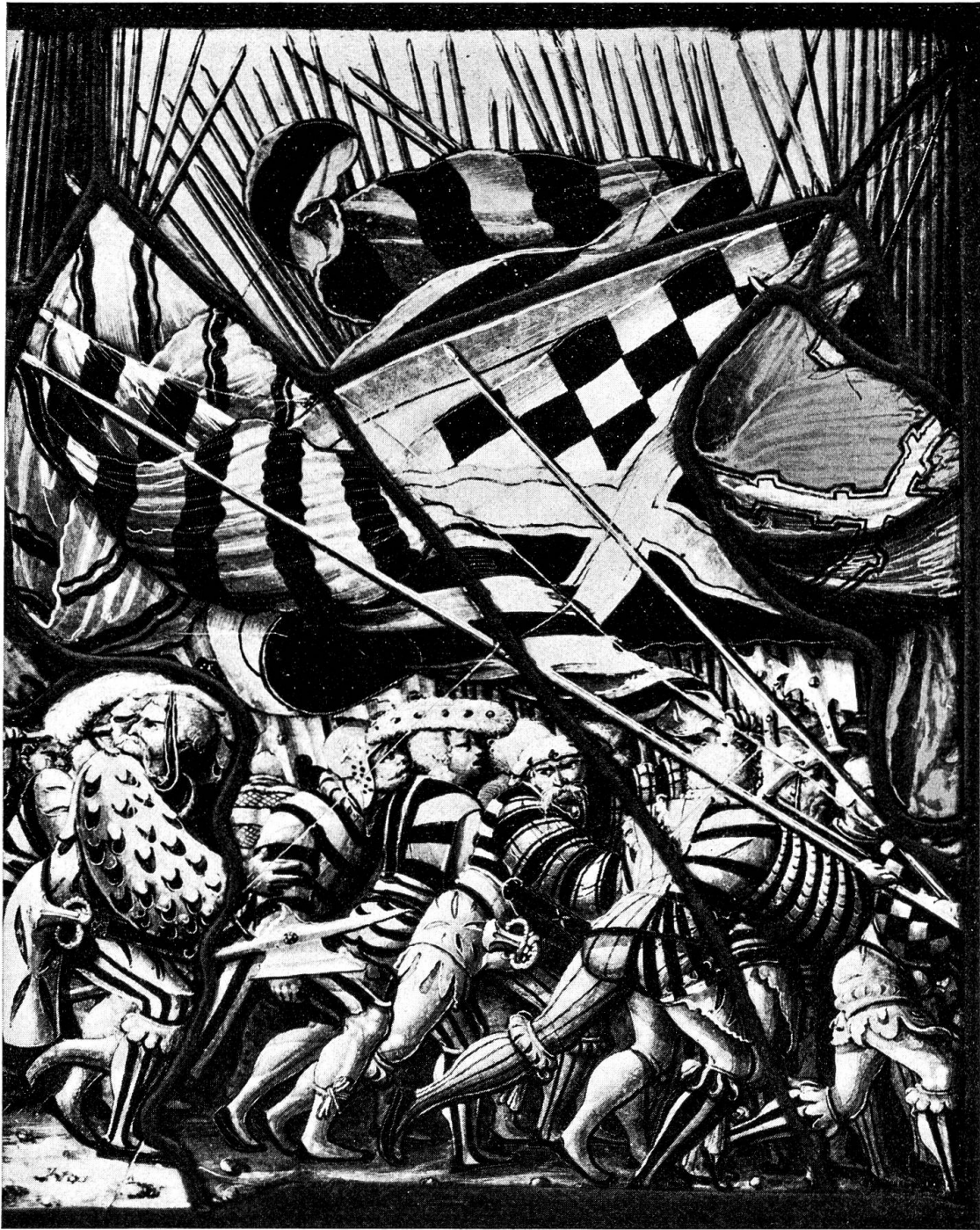
Abb. 5. Novara 1513: Flucht der Landsknechte (Detail Oberlicht)