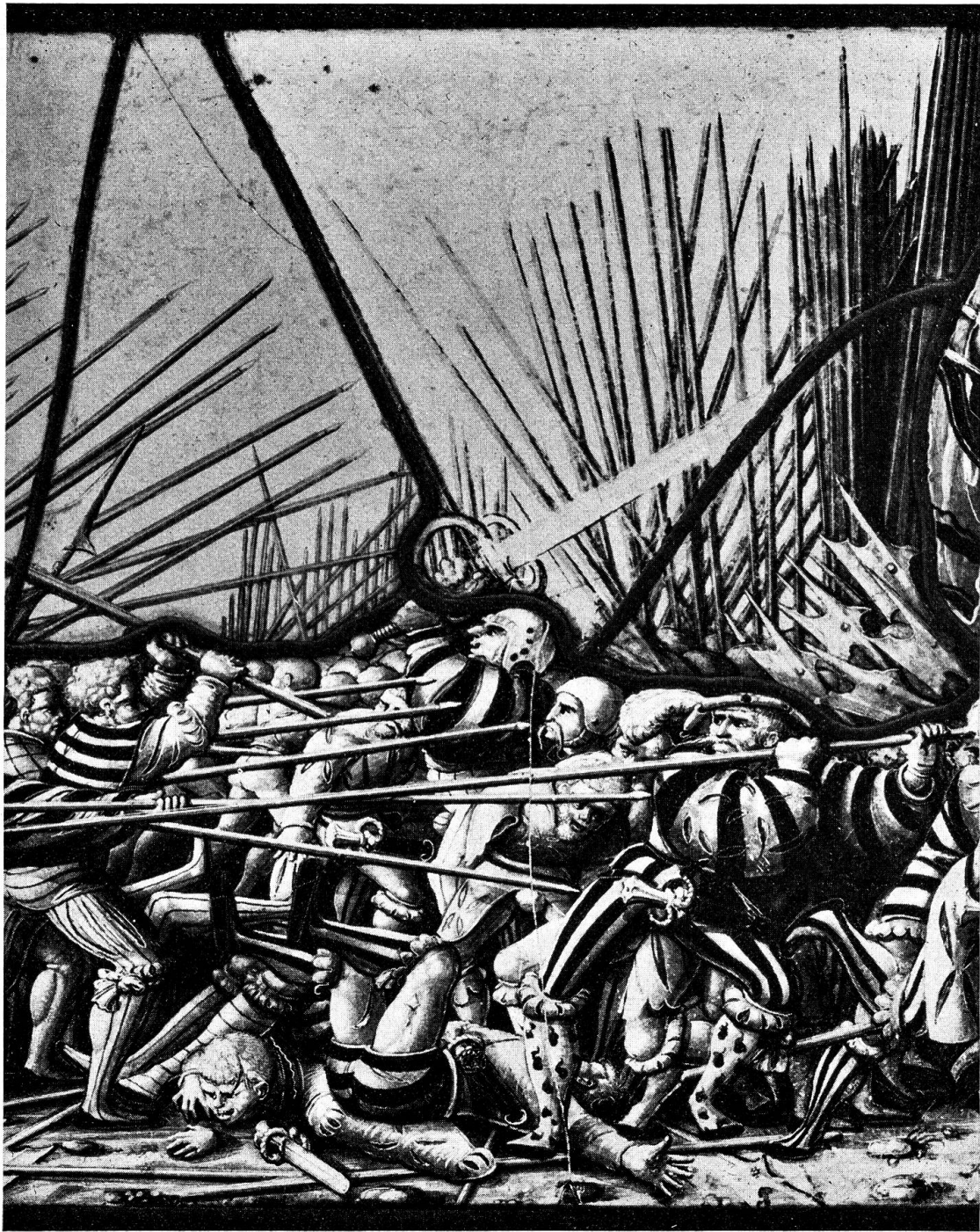
Abb. 4. Novara 1513: Kampf zwischen Eidgenossen und Landsknechten (Detail Oberlicht)