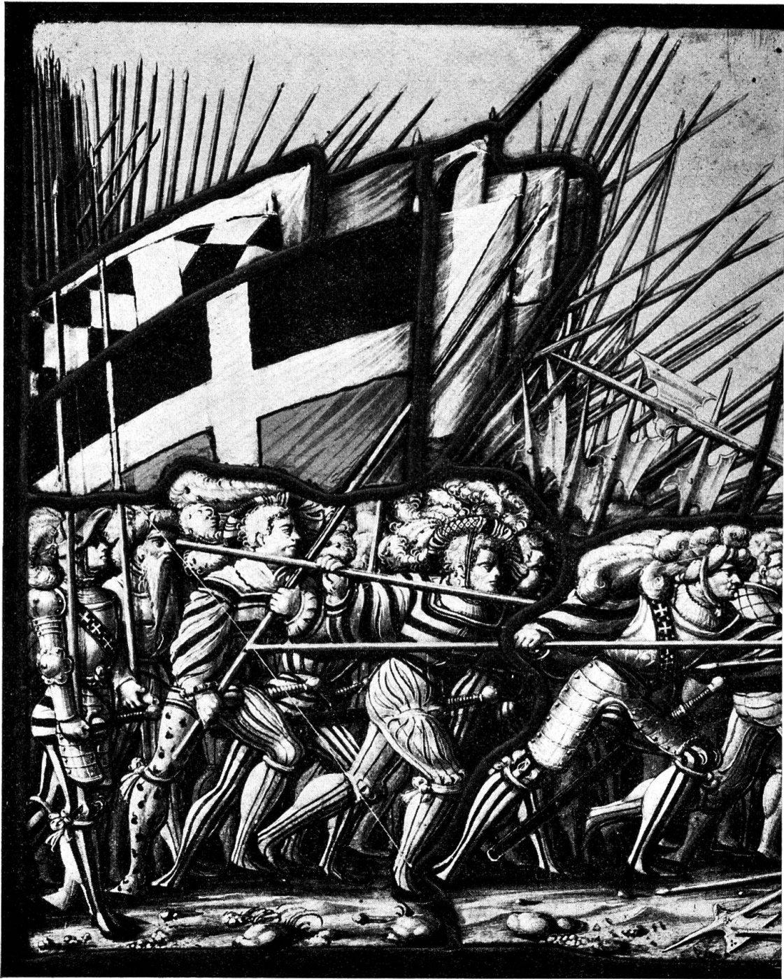
Abb. 3. Novara 1513: Angriff der Eidgenossen (Detail Oberlicht)