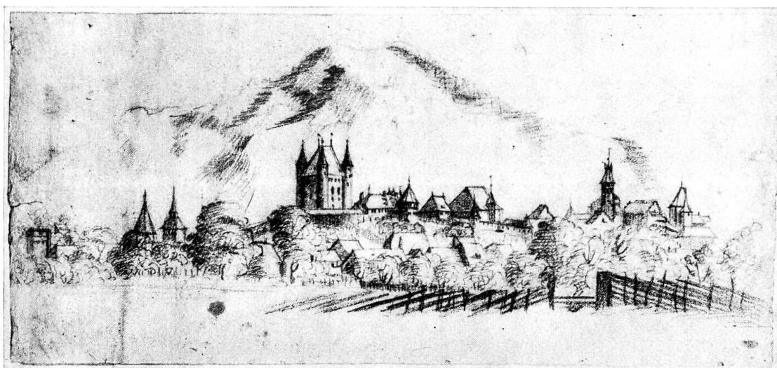
Abb. 1. Thun am Thunersee, um 1738. Rötzelzeichnung. München, Sammlung Rudolph S. Joseph

Thun, das eigentliche Tor des Schweizer Alpenlandes, mit den Augen des 18. Jahrhunderts gesehen, repräsentiert sich auf einer Rötzelzeichnung (Höhe 15 cm, Breite 33 cm) in Münchner Privatbesitz (Abb. 1) 1 . Die Landschaft konnte bisher