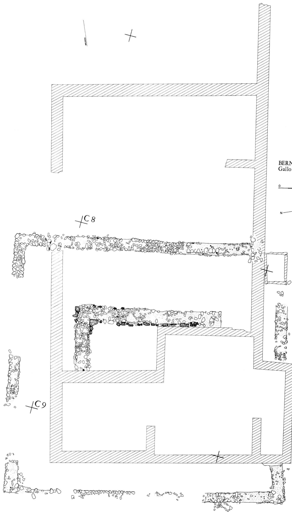
BERN, ENGEMEISTERGUT 1969 Gallo-römischer Vierecktempel