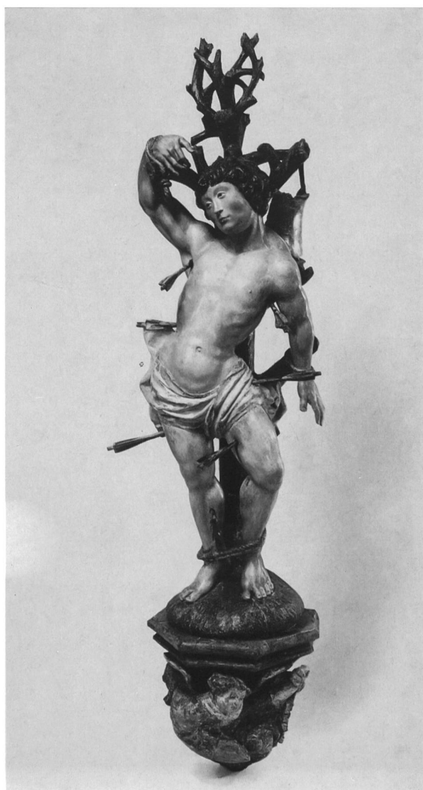
Abb. 4. Hl. Sebastian, Bemaltes Nußbaumholz, Höhe 73 cm, mit Konsole 121 cm, Amsterdam, Rijksmuseum.

weist die Rückseite des Baumstammes eindeutig das eingeritzte Stadtwappen von Mecheln auf (Abb. 3).