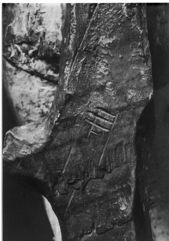
Abb. 3. Eingeritztes Stadtwappen Mecheln an der Rückseite des Baumes der Sebastiansfigur in Bern.

Die Qualität dieser Figuren ist sehr unterschiedlich. So fein wie die einen, so grob sind die andern geschnitzt, so daß man letztere schon eher zur Volkskunst zählen sollte. Die polychrome Bemalung, wozu auch die Goldfarbe gehört, verleiht ihnen ein eigenes und farbenfrohes Kolorit. In Gold ist oft der Mantel der Maria gefaßt, so zum Beispiel bei der kleinen Marienfigur im Kunstmuseum in Düsseldorf (Leihgabe der Sammlung Schwartz in Aachen). Auch einzelne Gewandteile und Bordüren an den Frauenkostümen können in Gold gehalten sein. Größere Goldflächen sind des öftern mit dem eingepreßten Buchstaben «M» bezeichnet. Auf der ungefaßten und in gerader Fläche geschnittenen Rückseite ritzen die Bildschnitzer die drei senkrecht stehenden Balken des Mechelner Stadtwappens ein. Die goldene Schambekleidung des Sebastians in Bern enthält den eingepreßten Buchstaben «M» nicht, jedoch