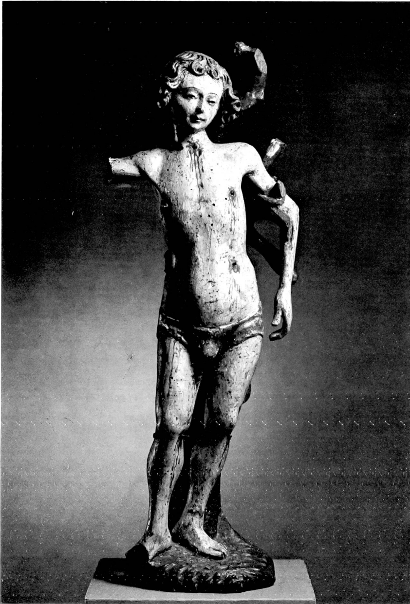
Abb. 1. Hl. Sebastian aus Mecheln.

sei noch auf eine letzte Variante hingewiesen. Angeregt von den traditionellen Bildtypen, die Christus im Elend oder als Schmerzensmann darstellen, band der fränkische Bildhauer Tilman Riemenschneider die Hände seines Sebastians (Mainfränkisches Museum, Würzburg) kreuzförmig übereinandergelegt an einen Ast des Baumes, der somit dem Marterpfahl Christi gleichkommt.