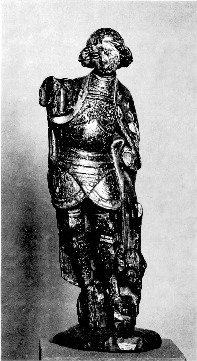
Abb. 5. Hl. Michael. Bemaltes Eichenholz, Höhe 37,5 cm. Amsterdam, Rijksmuseum.

voor Openbare Onderstand in Mecheln gehört. Diese Plastiken, zwei weibliche und vier männliche Heilige, weisen Formate auf, deren Höhen zwischen 72 und 80 cm variieren. Die Höhe des Sebastians in Amsterdam beträgt ohne Sockel 69,5 cm und diesen mitgemessen sogar 121 cm 7 . Der Berner und der Amsterdamer Sebastian dürften meines Wissens, mit Ausnahme der verschiedenen segnenden Jesuskinder, die einzigen Plastiken sein, bei welchen die Bildschnitzer es wagten, einen nackten Körper zur Darstellung zu bringen. Die beiden Sebastiansfiguren unterscheiden sich allerdings durch die verschiedenen Höhenmaße. Zudem gehört jede Figur einer andern Stilrichtung an, spricht doch aus der zeitlich jüngeren Amsterdamer Figur ein völlig anderes Gefühl