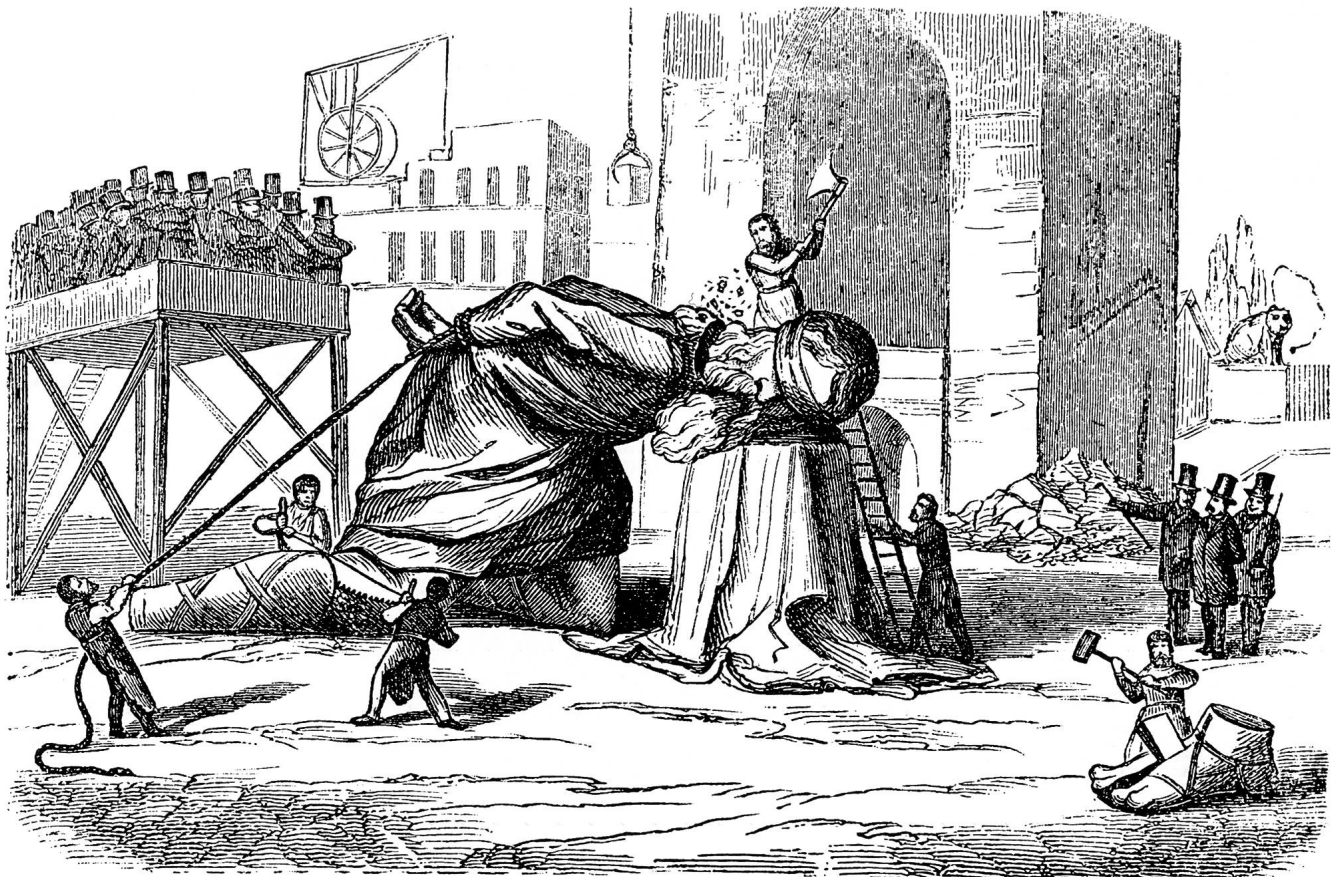
Abb. 69: «Als wie der größte Mann Berns auf Befehl der kleinen Götter des Materialismus geopfert und enthauptet wird.» Die Schweiz . Illustrierte Zeitschrift für schweiz. Literatur, Kunst und Wissenschaft, März 1865, Nr. 3.

Das Restaurations-Comite für den Christoffelthurm.