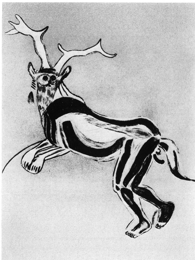
Abb. 3. Les Trois Frères (Ariège) Der «Zauberer» von Les Trois Frères .

gleichartiger, wenn auch relativ einfacher Geröllgeräte durch Australopithecus . Anfertigung und sinnvoller Gebrauch, danach Verwahrung zu weiterer Benutzung, das sind «geistige» Leistungen, die über denen heutiger Menschenaffen stehen.