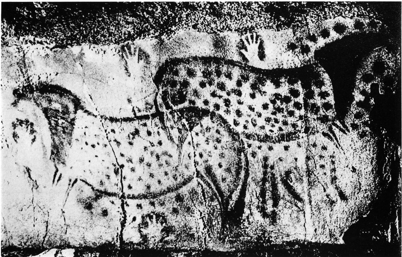
Abb. 4. Pech-Merle (Lot) Wildpferde und Negative menschlicher Hände.