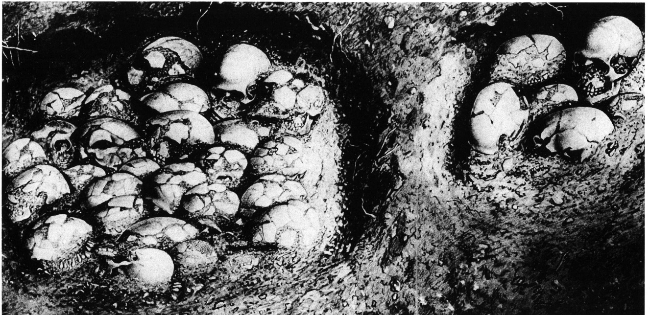
Abb. 5. Grosse Ofnet-Höhle bei Nördlingen (Bayern) Schädelgruben.