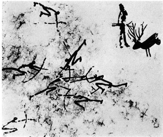
Abb. 6. Morella la Vella (Castellón) Kampfszene mit Bogenschützen.

Der nacheiszeitliche Mensch lernt auch bald, an zwei getrennte Welten zu denken/glauben, an eine materielle im