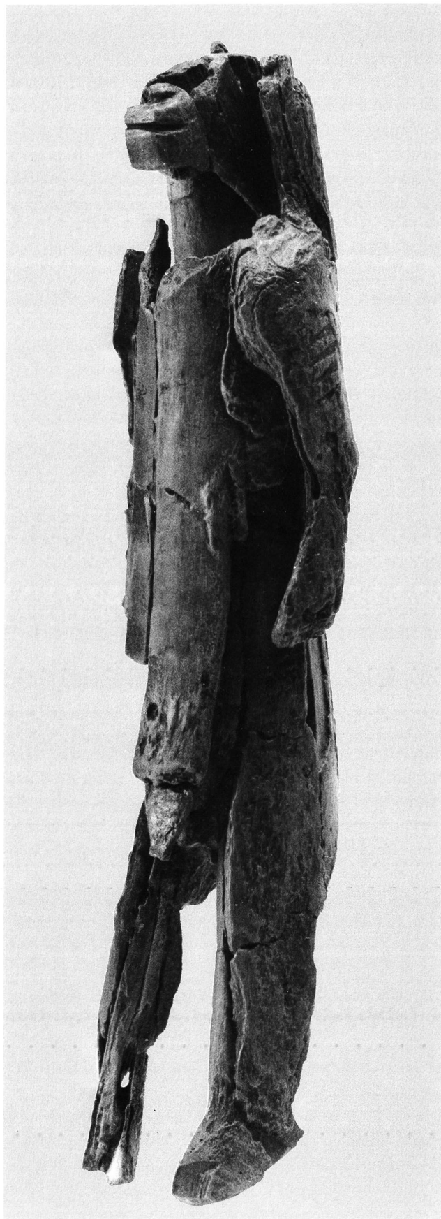
Abb. 2. Hohlenstein-Stadel im Lonetal ▷ Löwenköpfige Vollplastik aus Mammutelfenbein. Aurignacien. Rekonstruktionszustand 1982/83. Höhe 28,1 cm.

Das erste Objekt ist eine kleine Mammutelfenbeinplatte von 3,8 \times 1,0 \times 0,7 cm, die 1979 in der Aurignacien-