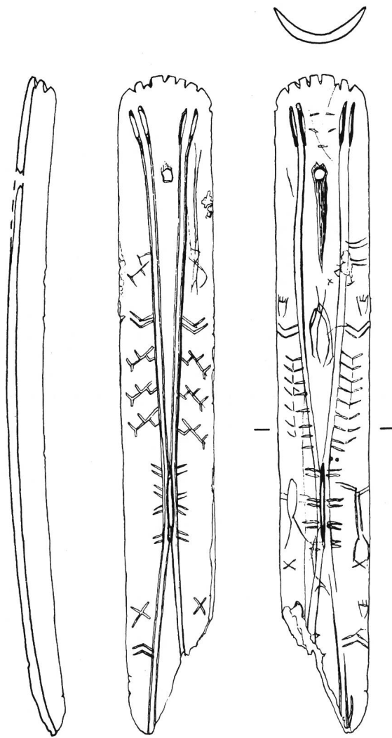
Abb. 3. Umingmak auf Banks Island in Nordkanada «Flesher» aus Karibugewei, mit mythischer Bärengravierung auf der Aus- sen- und Innenseite (rechts). Pre-Dorset. Erhaltene Länge 13,5 cm.

Wortsinne so bezeichnet werden können, derart eindeutig, dass der Gesamtinhalt der sicher erzählenden Darstellung lesbar und verständlich wird. Auf der äusseren, konvex aufgewölbten Fläche werden die vier oberen Lochungen durch Doppellinien mit einem zentralen Loch verbunden, bei dem sie sich berühren, um danach wieder auseinanderzustreben. Die sicher als Vorderende zu definierende Schmalseite ist gezähnt, was der Funktion des «Fleshers» als kratzend-schabendes Gerät entsprechen würde. Diese Zähnung ist in Amerika besonders als Merkmal von Bären Darstellungen wichtig (W. LINDIG 1972). Klar erkennbar sind drei angewinkelte Extremitäten. Eine vierte ist mit einem Teil des Objektes abgebrochen. Sie werden durch die Zugabe von unzweifelhaften Tatzensignaturen, die Schlüsselfunktion