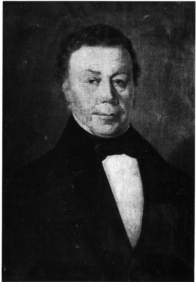
Abb. 2 und 3. I. Venetz im Alter von 38 (1826) und 66 Jahren (1854). Gemälde von Lorenz Justin Ritz (1796–1870).

chute» 7 . Im Jahre 1817 wurde von der erwähnten Gesellschaft eine Preisaufgabe ausgeschrieben mit dem Titel: «Ist es wahr, dass unsere höheren Alpen seit einer Reihe von Jahren verwildern?» Schon des öfteren hätte man nämlich von der Behauptung gehört, «dass das Klima der höheren Gegenden unsers Vaterlandes seit einer langen Reihe von Jahren allmählich rauher und kälter geworden sey. Da es an direkten Beweisen hiefür aus vieljährigen thermometrischen Beobachtungen fehlt, so hat man jene Meinung durch andere Umstände zu unterstützen versucht, welche als Erfahrungen angenommen werden, und die sich hauptsächlich auf folgende vier zurückführen lassen: Es sind erstens, Zeugnisse, dass verschiedene Plätze in den Alpen ehemals zur Viehweide benutzt worden seyen, die jetzt für diesen Zweck untauglich sind; zweytens, historische Zeugnisse und Spuren von ehemaligen Waldungen in solchen Höhen, welche über der Gränze der gegenwärtigen Baumvegetation sich befinden; drittens, fortschreitendes Nie-