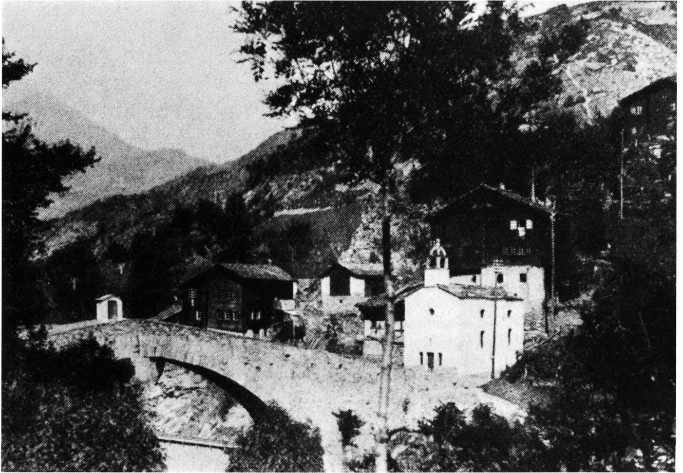
Abb. 1. Stalden-Neubrücke mit dem Stammhaus der Familie Venetz (links hinter der Brücke), das vor rund einem halben Jahrhundert dem Strassenbau zum Opfer gefallen ist.

Eisstürze, Wildbäche, die Eindämmung der Rhone, der Unterhalt von Brücken und Strassen zählten zu den Hauptaufgaben, mit denen sich der neue Kantonsingenieur in seiner gebirgigen Heimat zu befassen hatte. Im Jahre 1837 trat I. Venetz als Ingenieur in waadtländische Dienste, wo er insbesondere die vorher schon mehrmals misslungene Eindeichung der Bucht von Clarens am Genfersee an die Hand nehmen wollte. Nach anfänglichen Erfolgen wurden aber auch die von ihm geplanten Dammbauten bei heftigen Gewitterstürmen verschiedentlich beschädigt und zerstört. Der entmutigte und verschuldete Ingenieur wandte sich daraufhin der Korrektur der Orbe und der Broye zu. Schliesslich kehrte I. Venetz im Jahre 1855 aber wieder in seinen Heimatkanton zurück und arbeitete eine Zeitlang für das Eisenbahnprojekt der «Ligne d'Italie par le Simplon». Seine allerletzten Anstrengungen galten der Entsumpfung der Rhoneebene zwischen Saxon und Riddes. Im Verlaufe dieser Tätigkeit erkrankte I. Venetz an einer schweren Lungenentzündung, an deren Folgen er am 20. April 1859 im Alter von 71 Jahren starb.