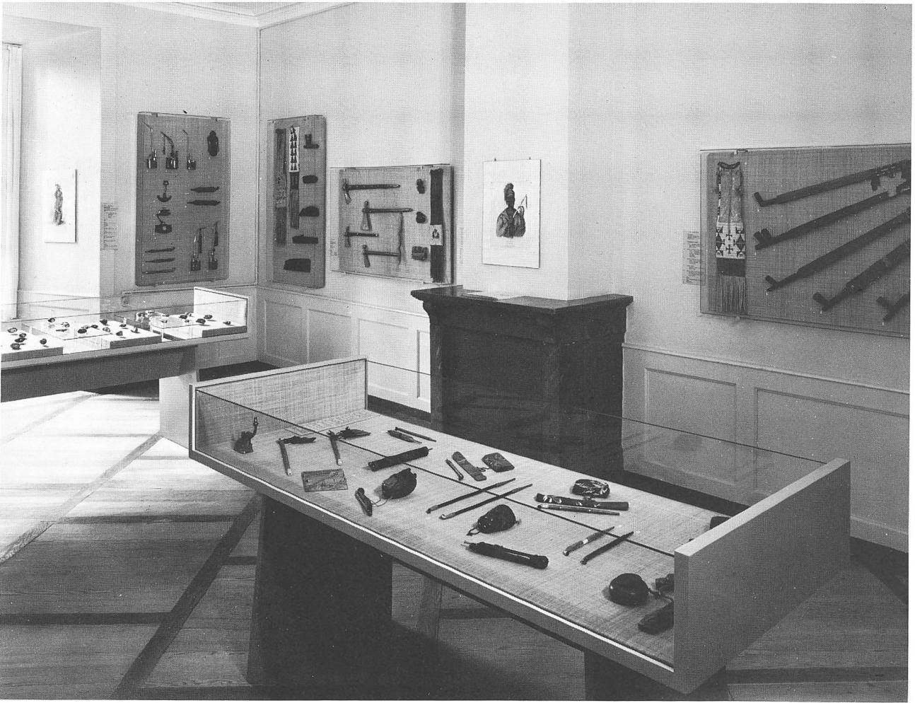
Schloss Oberhofen: Blick in die Sonderausstellung «Tabakpfeifen aus aller Welt» (1972/73)