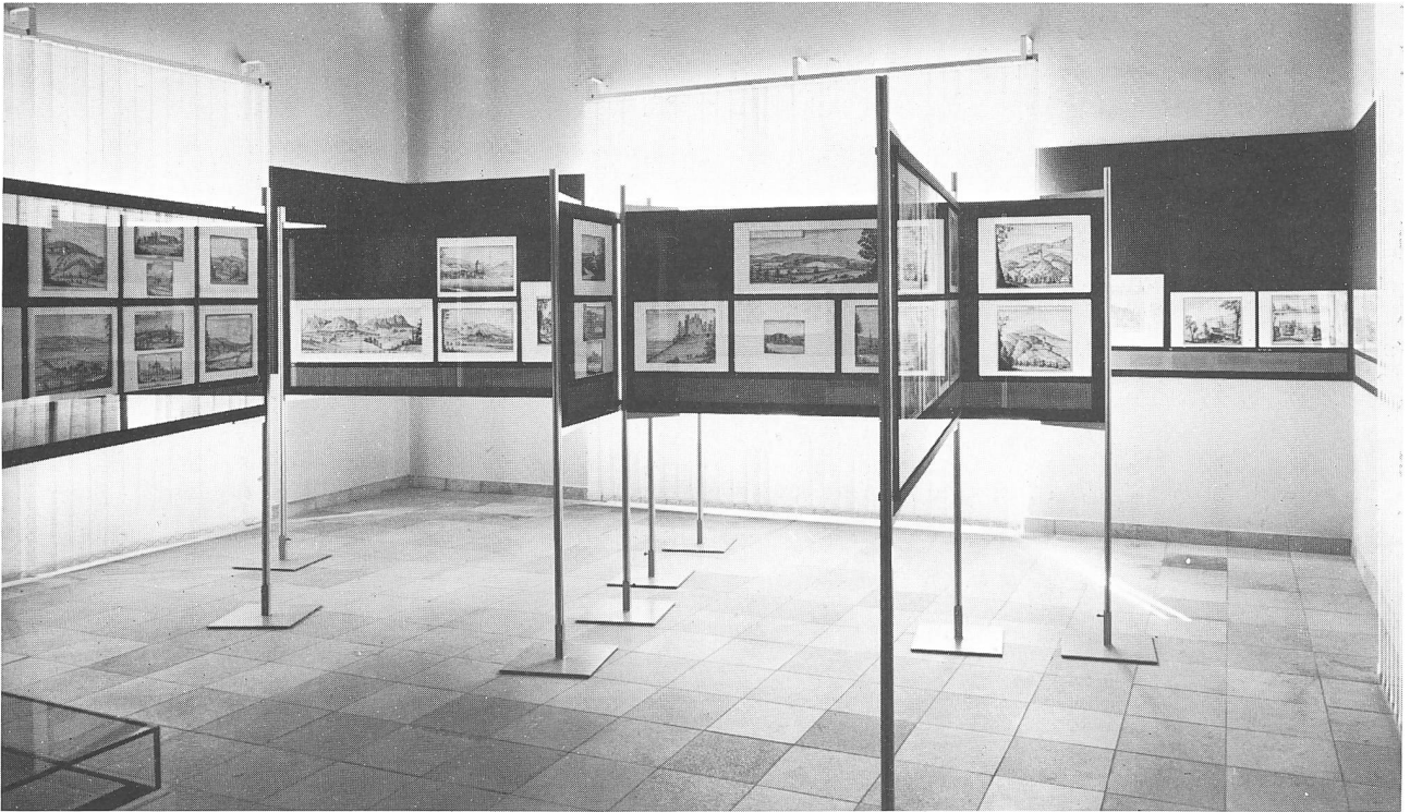
Blick in die Ausstellung «Bernische Baudenkmäler im 17. Jahrhundert — Sammlung Albrecht Kauw» (Winter 1975/76)