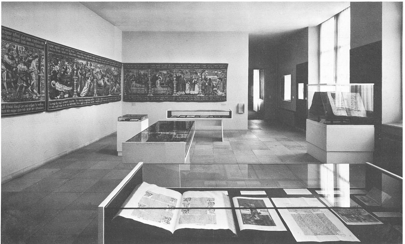
Blick in die Ausstellung «Bern und der Heilige Vinzenz» (Winter 1976/77) (vgl. S. 69)