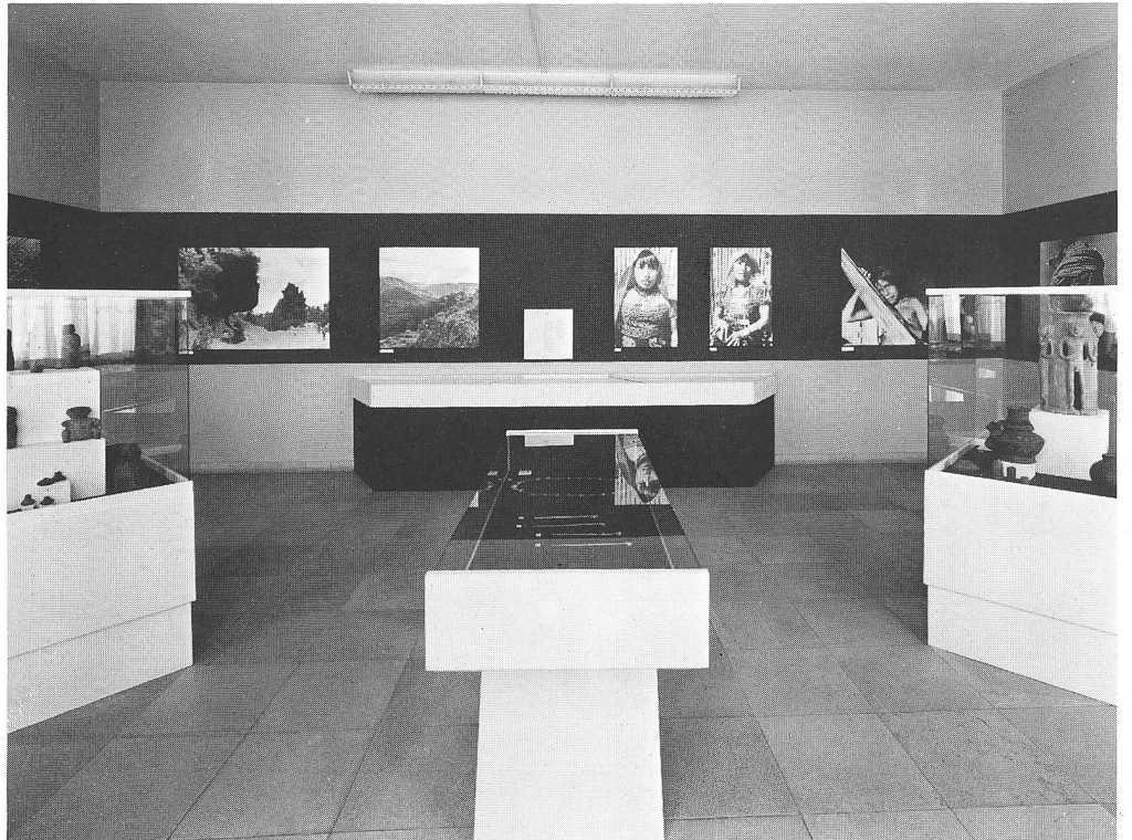
Blick in die vom Schweizerischen Bankverein organisierte Wanderausstellung präkolumbischer Goldschmiedearbeiten und Keramik aus dem «Museo del Oro» in Bogota (1975)