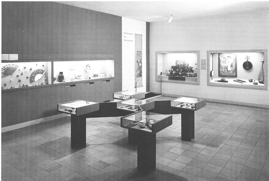
Ausstellung «Kunsthandwerk aus China und Japan» (1971–1974) (vgl. S.105)