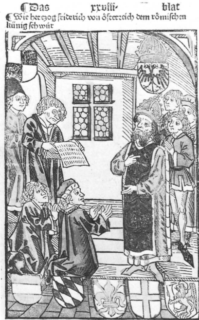
Ulrich von Richental, Beschreibung des Konzils von Konstanz, erschienen 1483 bei Anton Sorg, Augsburg: Herzog Friedrich von Oesterreich vor dem römischen König

Sammlung das Pergamentblatt zu erwähnen, das um 1350 geschrieben und mit grossen bunten Initialen versehen wurde. Es enthält eine Vinzenzen-Antiphon (40374). Ein derartiger liturgischer Gesang dürfte auch im Berner Münster, dessen Schutzpatron der Hl. Vinzenz war, anlässlich der täglichen Chorgebete gesungen worden sein. Das Museum besitzt bereits zahlreiche Glasgemälde mit Darstellungen des Hl. Vinzenz und auf vier Teppichen auch die Darstellung der Legende dieses Märtyrer-Heiligen in 18 Einzelszenen, die 1515 von dem Chorherrn Heinrich Wölfli dem Berner Münster gestiftet wurden. Deshalb bedeutet die Vinzenzen-Antiphon eine sinnvolle Ergänzung.