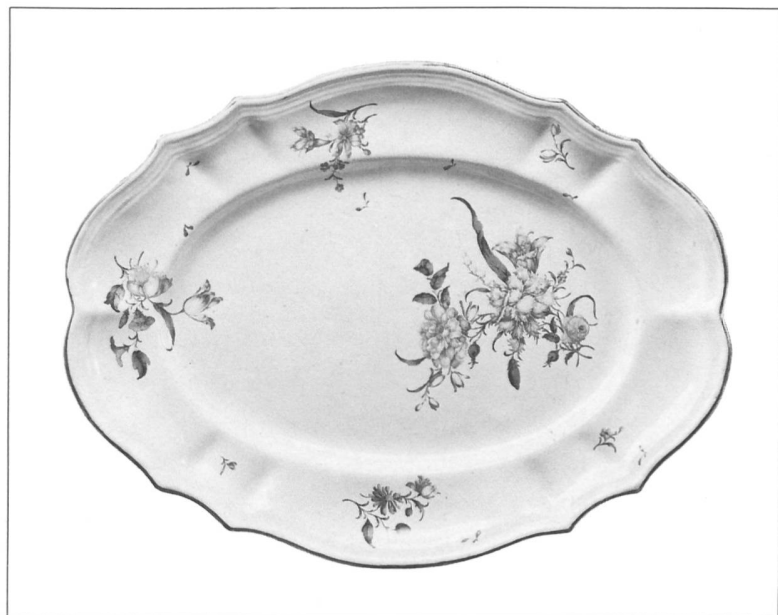
Manufaktur Frisching, Bern, um 1760-1777: Fayence-Platte. Vgl. S. 35