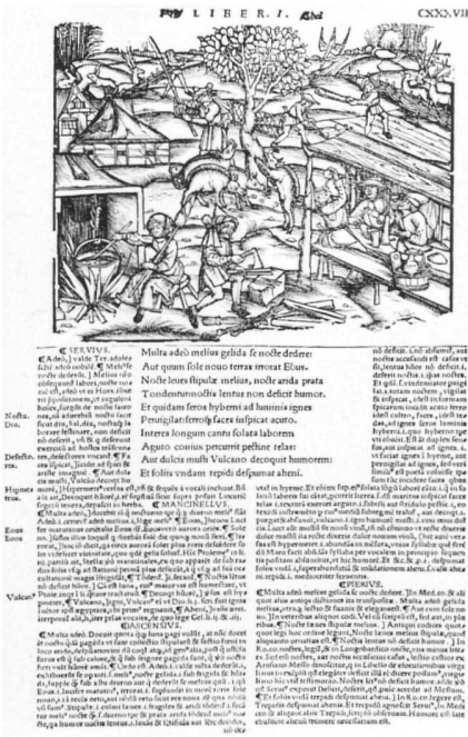
Vergil, Opera, erschienen 1502 (?) bei Johann Grüninger, Strassburg: Darstellung aus dem Landleben