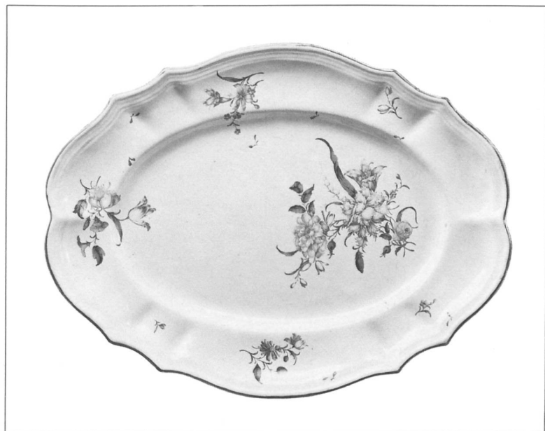
Manufaktur Frising, Bern, um 1760-1777: Fayence-Platte. Vgl. S. 35