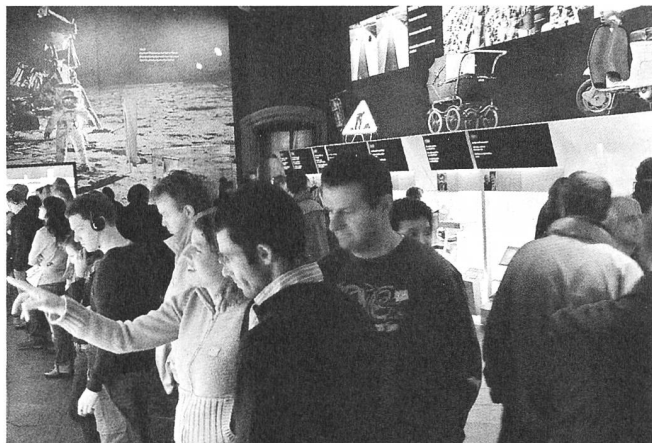
Spurensuche in der eigenen Vergangenheit: die 50er und 60er Jahre