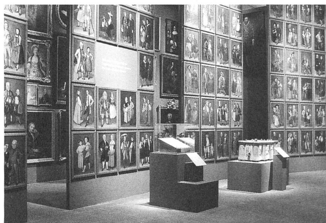
Berns Weg ins 19. Jahrhundert: Joseph Reinharts Porträtzyklus verkörpert die zukünftigen Bürger der Schweiz.

Die Geschichte des 20. Jahrhunderts, in dem innerhalb weniger Generationen sich so vieles so schnell verändert hat, auf diese Weise zu erzählen, schien uns eine interessante und kurzweilige Art, die riesige Stoffmenge zu bündeln. Zwei Über- legungen haben uns vor allem an diesem Konzept überzeugt: Zum ersten wird die Geschichte des 20. Jahrhunderts so nicht als Aneinanderreihung von Krisen, Verwerfungen und Katastro-