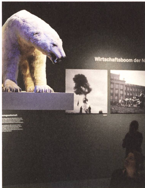
Ein Blick hinauf zum Eisbären aus dem Lied «dr Eskimo».