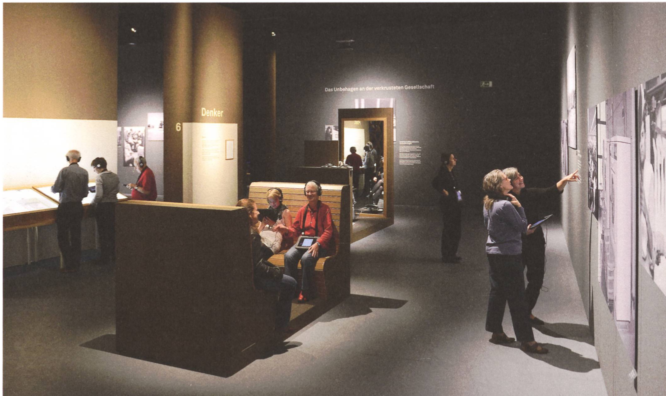
Die Ausstellung griff verschiedene Facetten aus Mani Matters Biografie und aus seinen Liedern auf.