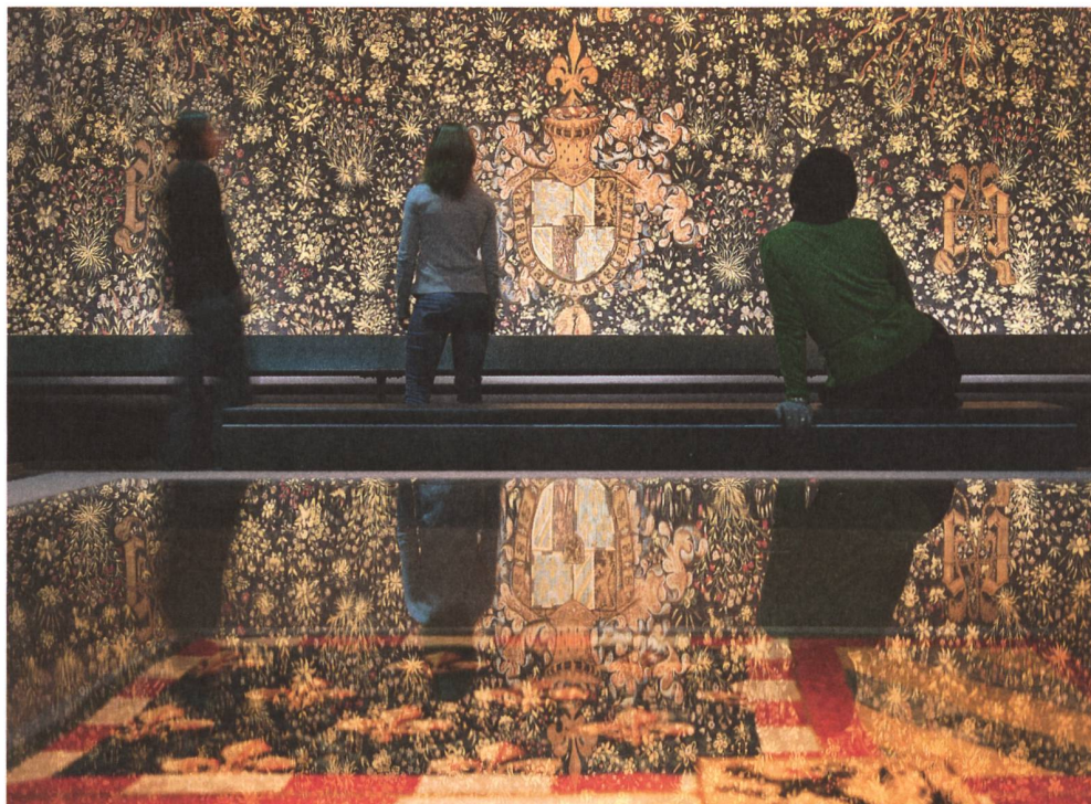
Blick auf die textilen Schätze aus der Burgunderbeute, Mai 2012.