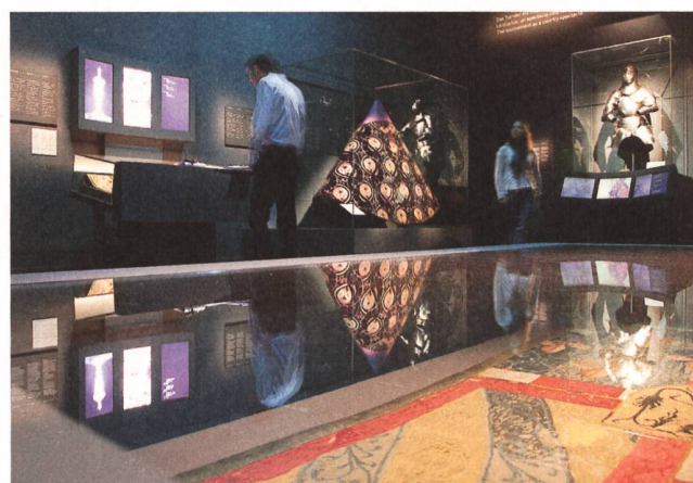
Fahnen, Rüstungen und kostbare Gewänder unterstreichen die Macht der Fürsten.

Berner Rathaus. Damit fand die Reise des Werkes von Zypern über London nach Lausanne und schliesslich Bern ihr vorläufiges Ende.