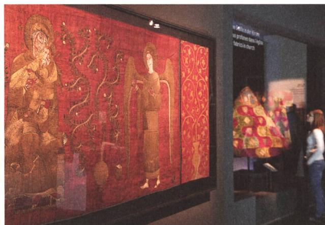
Blick auf das Antependium von Otto von Grandson und den Ornat der Herrinnen der Waadt.

Nach Bern gelangte der kostbare Altarbehang 1537, als die Berner nach der Reformation den Schatz der Kathedrale von Lausanne hierher überführten. Sie hielten kirchliche Pracht für überflüssig, und die Goldstickerei verschwand in Kisten im