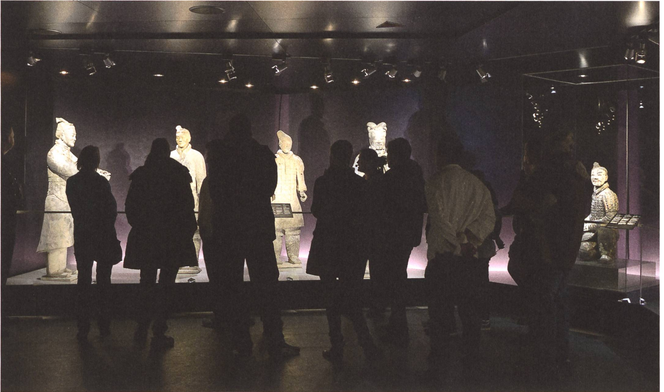
Besucherinnen und Besucher auf Augenhöhe im Dialog mit den Terrakottakriegern.

Center in Xi'an zehn Terrakottafiguren aus der Grabanlage des Ersten Kaisers sowie weitere rund 220 archäologische Objekte aus dem ersten vorchristlichen Jahrtausend aus rund 20 Museen und archäologischen Institutionen der Provinz Shaanxi ausgeliehen werden. Parallel dazu wurde die Realisierung in Bern geplant. Einerseits die Ausstellung selbst und andererseits jene Räume und Flächen, die es braucht, um eine Ausstellung mit grossem Publikumsaufkommen sicher und für die Besucherinnen und Besucher angenehm durchführen zu können. Im Winter 2012/13 wurden dann in kurzer Zeit ein temporärer Pavillon im Museumspark und die Ausstellung selbst gebaut.