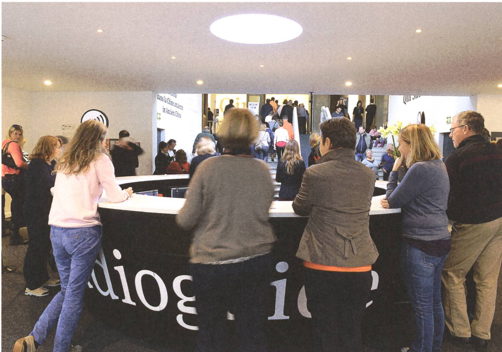
Das Ausstellungserlebnis begann im geräumigen temporären Pavillon im Museumspark.

Die Szenografie der Ausstellung fand mit einem begehbaren grossen schwarzen Rampenkörper ein ebenso stimmiges wie eindrückliches Bild für den Aufstieg des Reichs Qin und die Grabanlage des Ersten Kaisers. Zusammen mit den 8000 quecksilberfarbenen Fähnchen an der Decke und der subtilen Beleuchtung war die Ausstellung für die Besucherinnen und Besucher auch ein starkes visuelles Erlebnis.