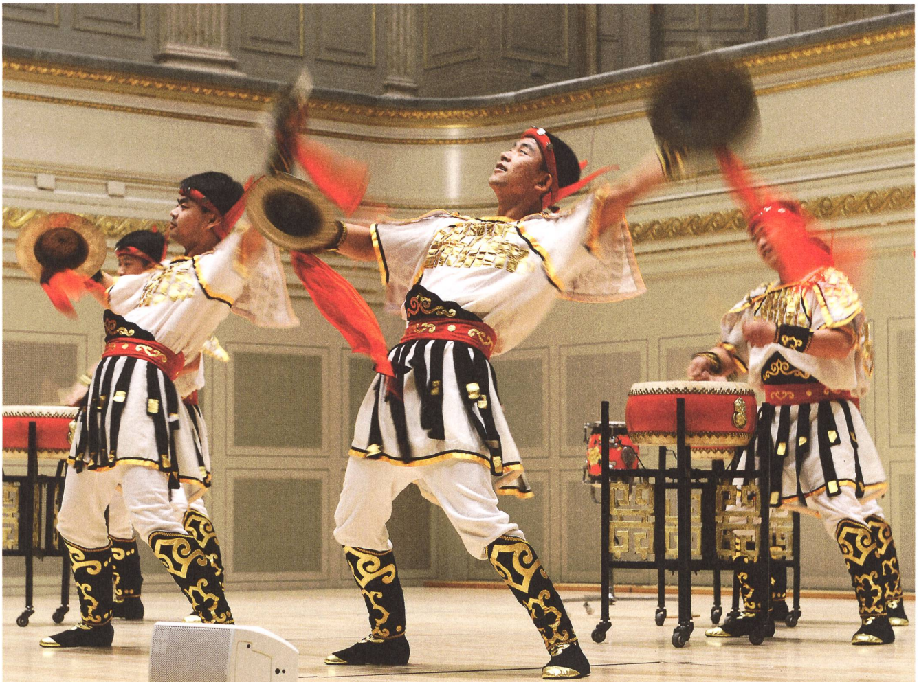
Vernissage mit der Jiangzhou Drum Troupe of Shanxi Province. Das traditionelle Trommelensemble aus China wurde aufgrund seiner Bemühungen um den Erhalt der antiken Trommeltradition 2002 zum UNESCO-Meisterwerk des mündlichen und immateriellen Kulturerbes ernannt.

Besonders erfreulich war die hohe Zahl von Ausstellungsbesuchern aus der französisch- und italienischsprachigen Schweiz. Ebenso der hohe Anteil von 66 %, der zum ersten Mal das Bernische Historische Museum besuchte. In qualitativer Hinsicht war die Zufriedenheit mit der Ausstellung sehr hoch: 96 % der Besucherinnen und Besucher hat die Ausstellung gut oder sehr gut gefallen. Dieser Befund wurde auch durch eine grosse Zahl von positiven Rückmeldungen per E-Mail, Brief oder im persönlichen Gespräch bestätigt.