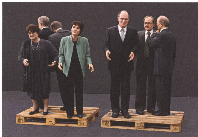
Der Bundesrat, wie er 2002 an der Expo in Biel/Bienne zu sehen war, in der Ausstellung.