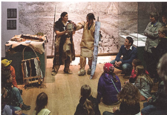
Zeitreise in die Bronzezeit.