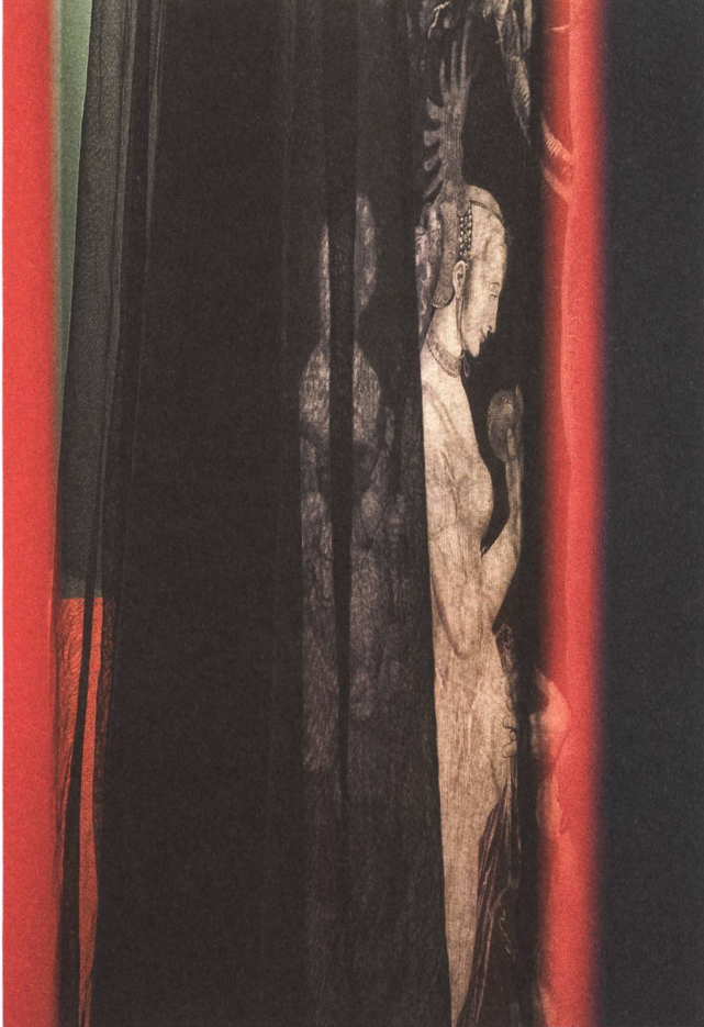
Exquisite Kunst für gebildete Männer.