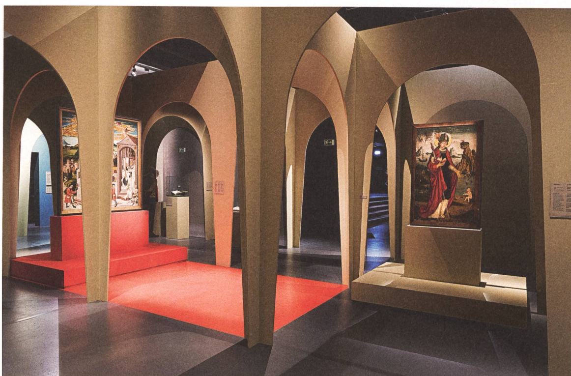
Altarbilder aus der Zeit von Niklaus Manuel inszeniert im städtischen Raum.