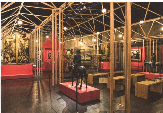
Kunstwerke inszeniert im kirchlichen Raum.