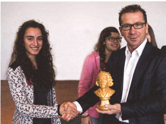
Verleihung des «Goldenen Albert» an die Schülerinnen und Schüler der SEK 1A, OSUA Klingnau.