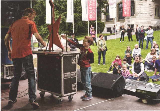
Interaktiver Auftritt der «Physikanten» im Museumspark.