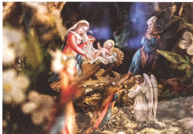
Detail einer Kastenkrippe, 1840, privater Leihgeber.