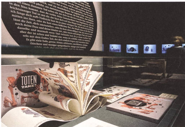
Eine zeitgenössische Totentanz-Interpretation temporär in der Dauerausstellung.