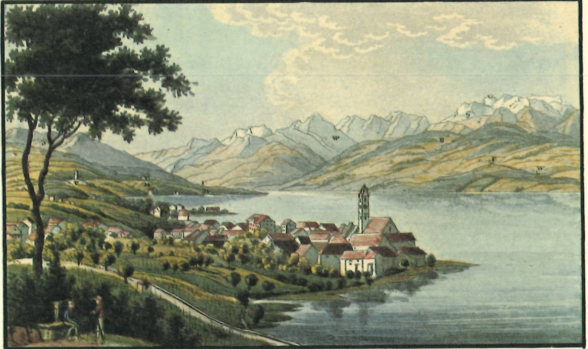
Aussicht zu Meilen am Zürich-See.

Schäniserberg Udikon Märedorf Stäfa WäggiThal Ezel Glärisch-Feusikirch Wolrau.