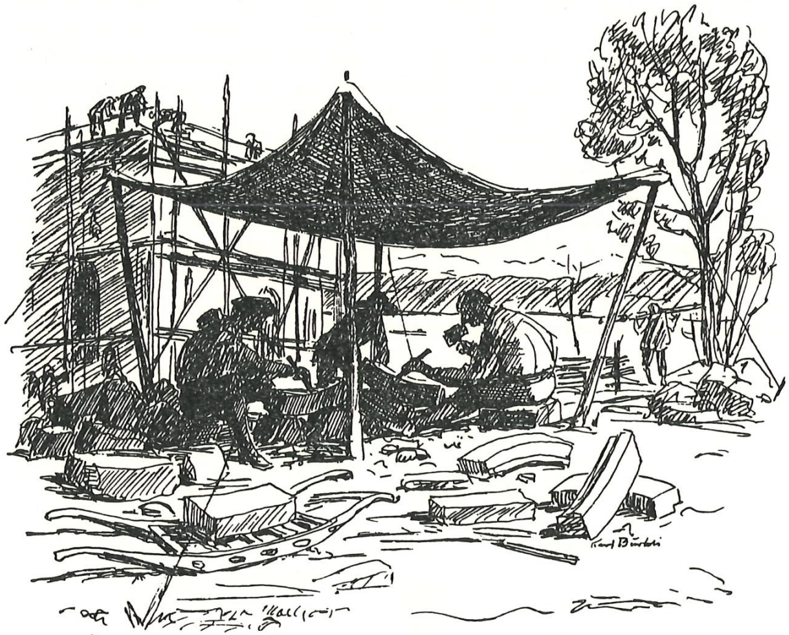
Neubau der Meilener Kirche 1493 - 1495.