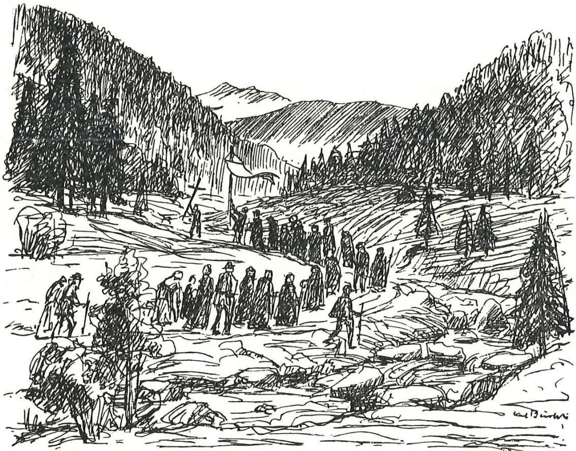
Die Meilener wallfahren am Pfingstmontag nach Einsiedeln. Zeichnungen zu diesem Beitrag von Karl Bürkli.

Heiligstöckli oder «helgenhüsli» (Helgen = Heiligenbild) in der Clotten, beim Hintern Pfannenstiel und bei der Grueb. Drei ständige Priester versahen den Kirchendienst: der Leutpriester, der Frühmesser und der Kaplan am Heilig Kreuz-Altar.