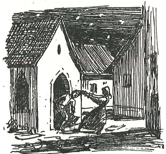
Bildersturm in Obermeilen.