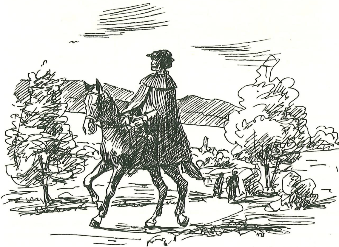
Der Meilener Pfarrer reitet jeden zweiten Sonntag nach Uetikon.

Anderes zeugt von Opfersinn für die Kirche. So hat nicht der «Kirchherr» — seit 1332 das Stift Einsiedeln — sondern die Gemeinde 1402 die Frühmesspfrund geschaffen und das Pfrundhaus erstellt, damit ein Frühmesser vor dem Marienbild auf dem neuerstellten Altar «Unserer lieben Frau» Messe las. Auch der Heilig Kreuz-Altar, 1472 geweiht, und die Kapelle in Uetikon wurden aus freiwilligen Beiträgen erstellt. Endlich darf der Neubau der Meilener Kirche, 1493 — 95, von dem sicher das Chor und der Turm stammen, als eine Tat der Kirchengenossen von Meilen gewertet werden. Die Meilener legten am 3. Mai 1493 den Grundstein und begannen mit dem Bau, obwohl der Zehntherr, also das Kloster Einsiedeln, nicht einverstanden war und sich weigerte, seinen Teil an die Baukosten zu leisten. Nach Gewohnheitsrecht hätten die Kirchengenossen das Schiff, das