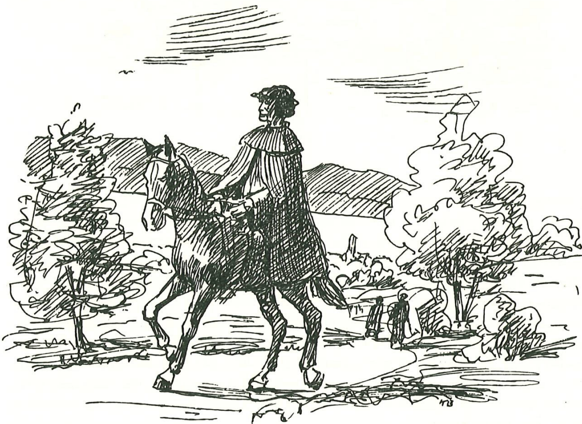
Der Meilener Pfarrer reitet jeden zweiten Sonntag nach Uetikon.

Anderes zeugt von Opfersinn für die Kirche. So hat nicht der «Kirchherr» — seit 1332 das Stift Einsiedeln — sondern die Gemeinde 1402 die Frühmesspfrund geschaffen und das Pfrundhaus erstellt, damit ein Frühmesser vor dem Marienbild auf dem neuerstellten Altar «Unserer lieben Frau» Messe las. Auch der Heilig Kreuz-Altar, 1472 geweiht, und die Kapelle in Uetikon wurden aus freiwilligen Beiträgen erstellt. Endlich darf der Neubau der Meilener Kirche, 1493 — 95, von dem sicher das Chor und der Turm stammen, als eine Tat der Kirchengenossen von Meilen gewertet werden. Die Meilener legten am 3. Mai 1493 den Grundstein und begannen mit dem Bau, obwohl der Zehntherr, also das Kloster Einsiedeln, nicht einverstanden war und sich weigerte, seinen Teil an die Baukosten zu leisten. Nach Gewohnheitsrecht hätten die Kirchengenossen das Schiff, das