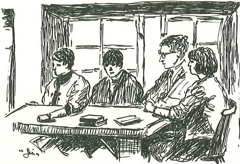
«Junge Kirche» im Bau.