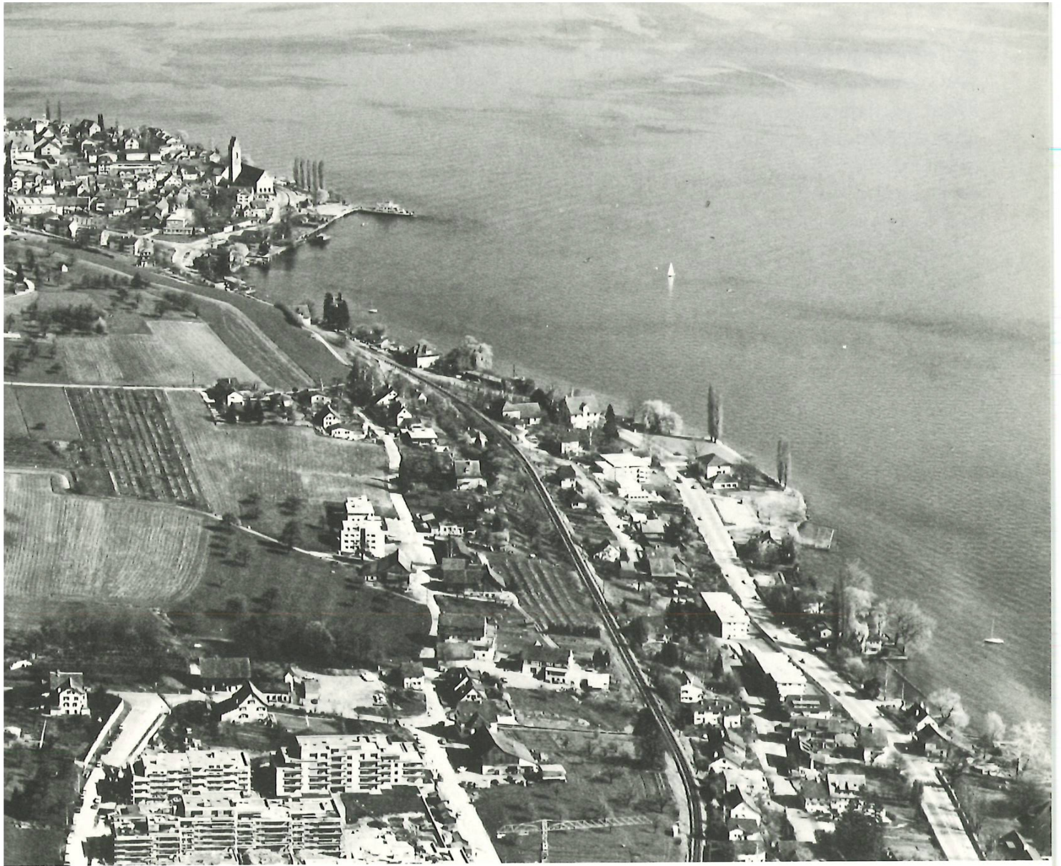
Flugaufnahme vom Frühjahr 1975. Am untern Bildrand ein Teil der neuesten Überbauung, zwischen Schulhaus und Schwabach. Im Hintergrund Dorfmeilen. (Man vergleiche hiezu S. 7).