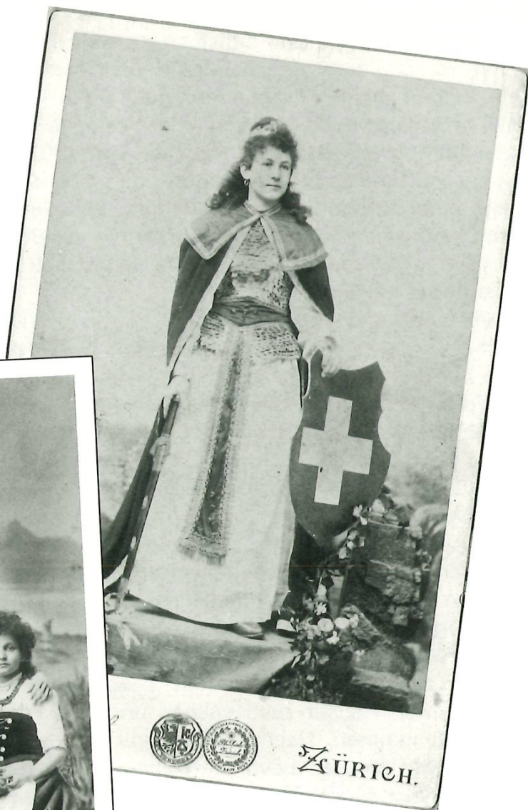
Das «Röschen» in «Die Hexe von Gäbistorf» (1898).