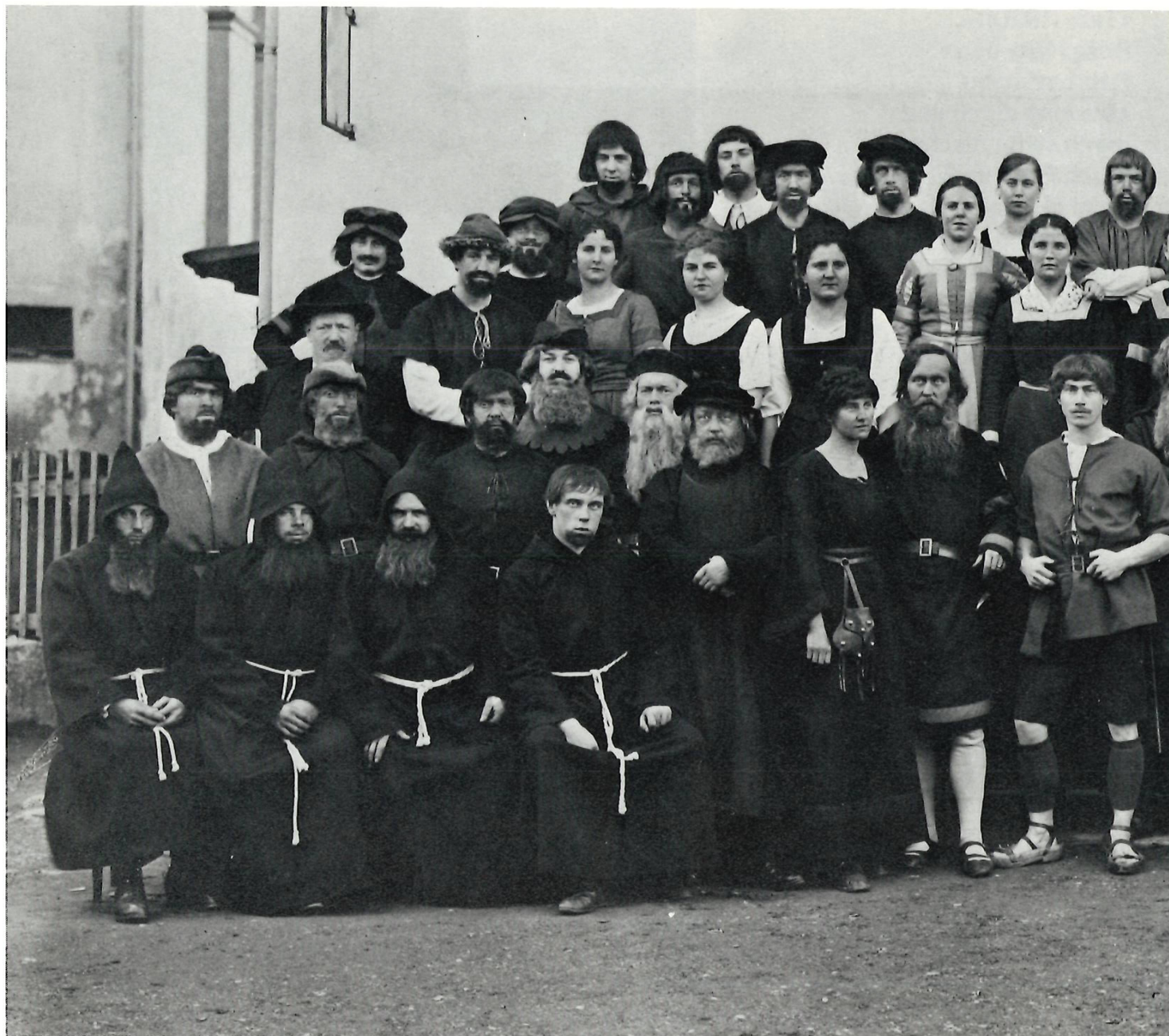
«Tellspiele Meilen» (1920)