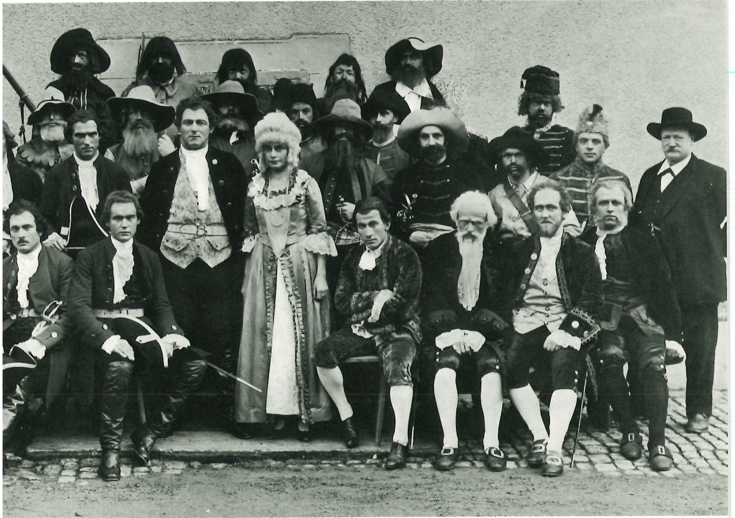
«Die Räuber» (1924)