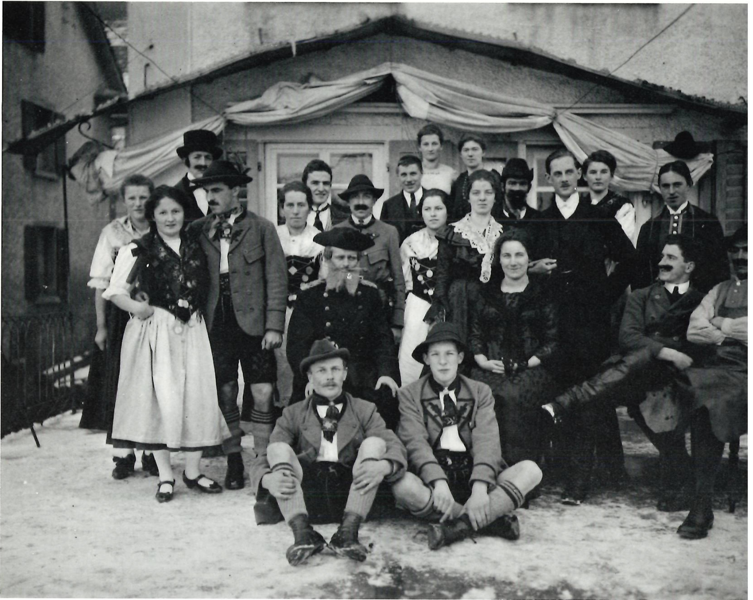
Die «Ammergauer Lise» in Obermeilen, (Gemischter Chor, 1920?).