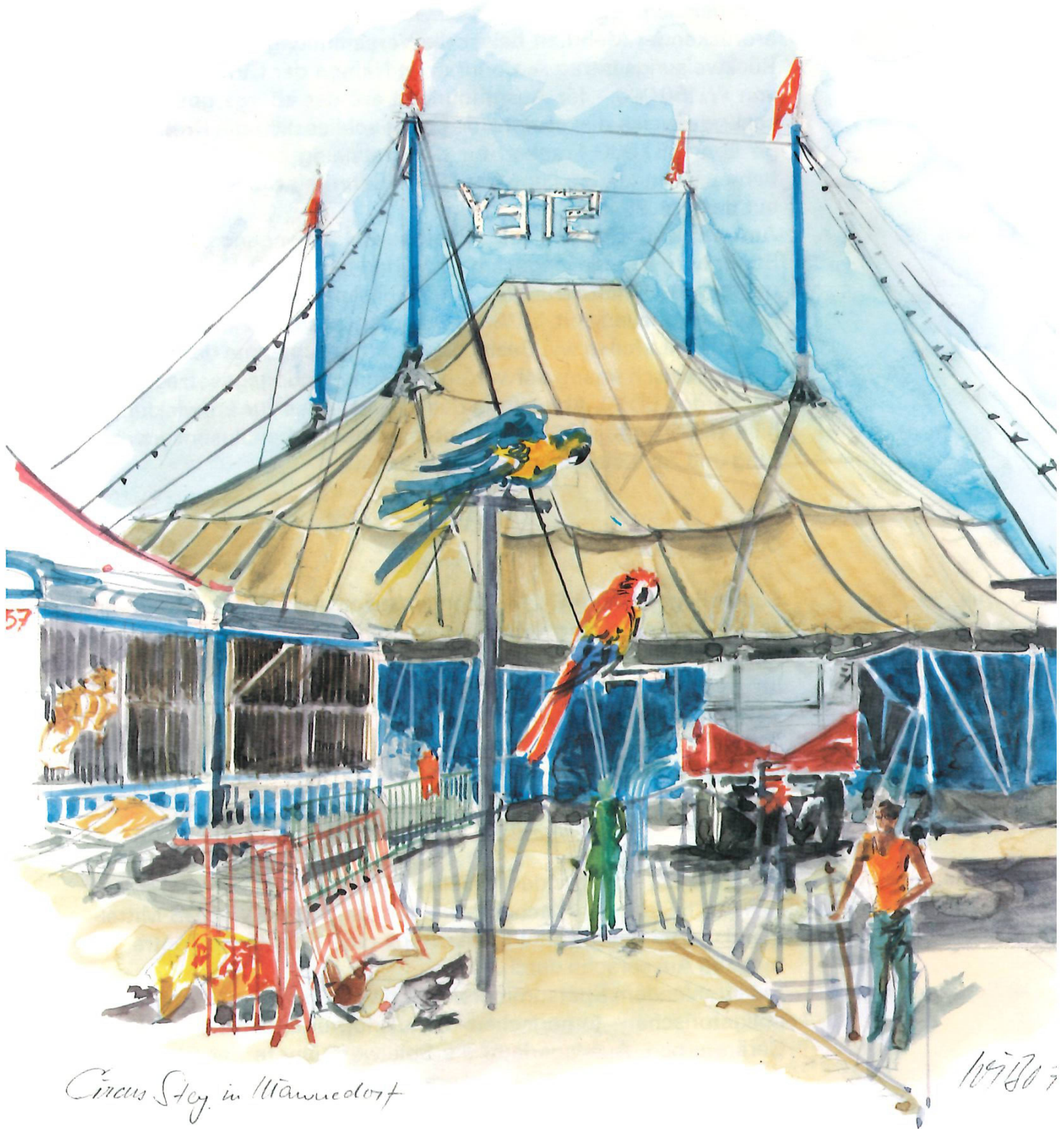
Circus Stey in Männedorf