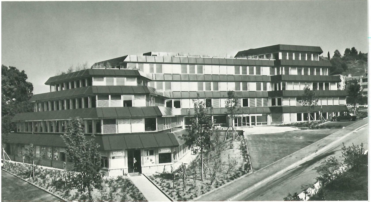
Der neue Hauptsitz des Hoval-Konzerns in Feldmeilen.