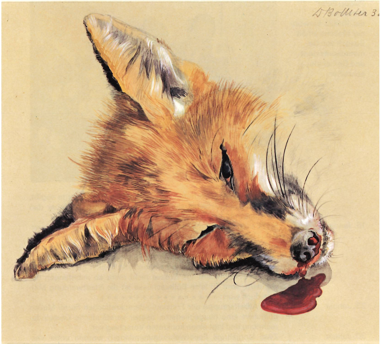
W. Bolleter: «Toter Fuchs», Verkehrsoffer auf der Seestrass beim Schipfgut in Herrliberg, Aquarell 1938.