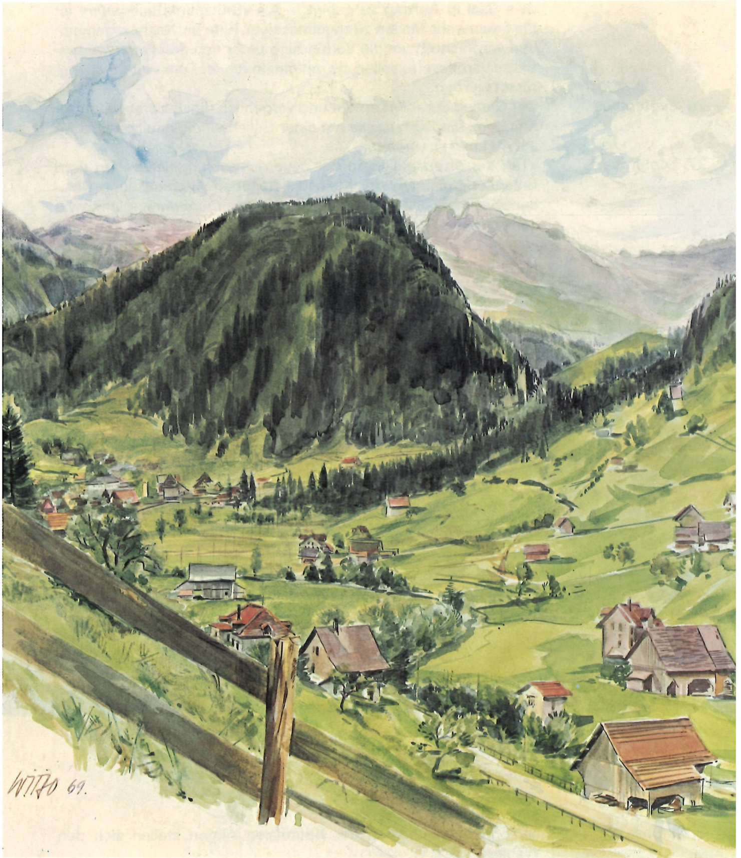
W. Bolleter: «Blick von Vorderthal Richtung Wägital, in der Bildmitte der Guggelberg, im Hintergrund der Mutteriberg, Aquarell 1969.