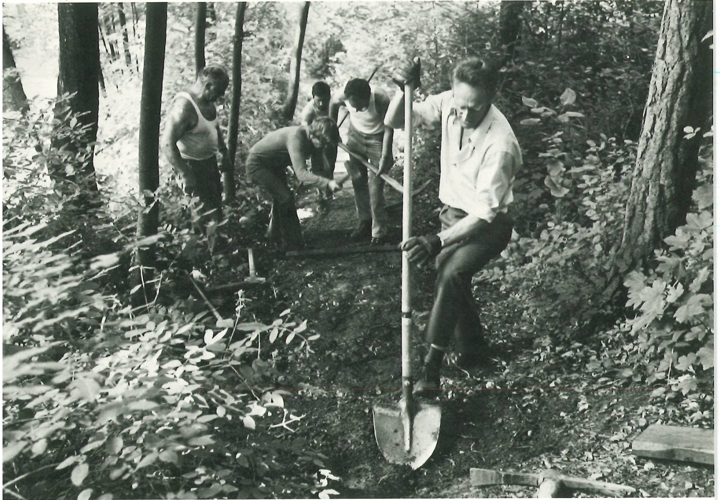
Vita-Parcours und Fitness-Testbahn werden von Freiwilligen der Männerriege instand gestellt, (29. Mai).