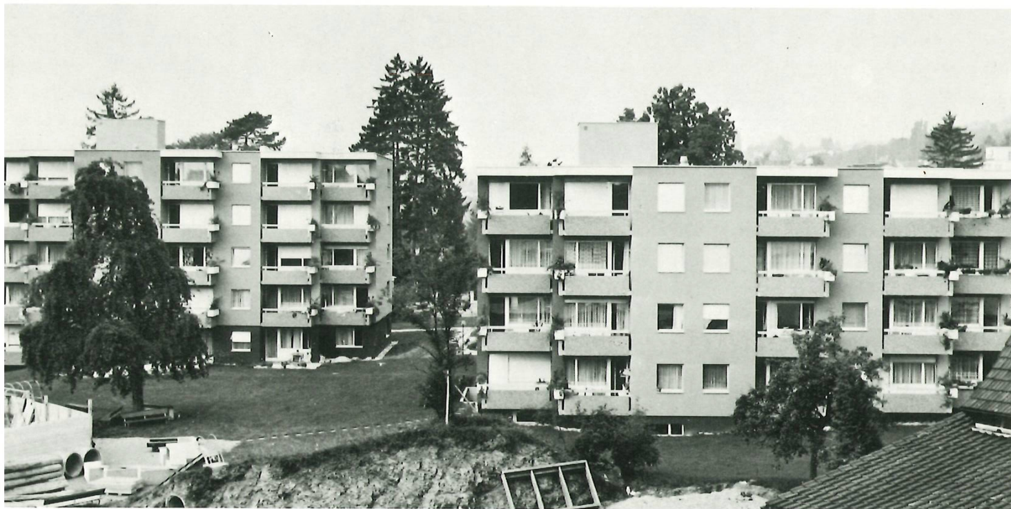
Die neue Alterssiedlung «im Wiesengrund» in Dollikon, Obermeilen; Ostfassade.

«Tag der offenen Tür» in der neuerrichteten, gleich neben dem Robinson-Spielplatz der Kleinen gelegenen Alterssiedlung Dollikon. Sie umfasst 42 Ein- und 17 Zweizimmerwohnungen sowie verschiedene Gemeinschaftsräume und ist unter der Bauherrschaft der Stiftung Alters- und Pflegeheim vom Architekturbüro G. Sameli & W. Weinbeck projektiert worden. Zur Ausstattung gehört auch ein farbenprächtiger Wandteppich «Nachsommer», der nach einem Entwurf von Frau G. Baumann als Gemeinschaftswerk der Frauenvereine entstanden ist.