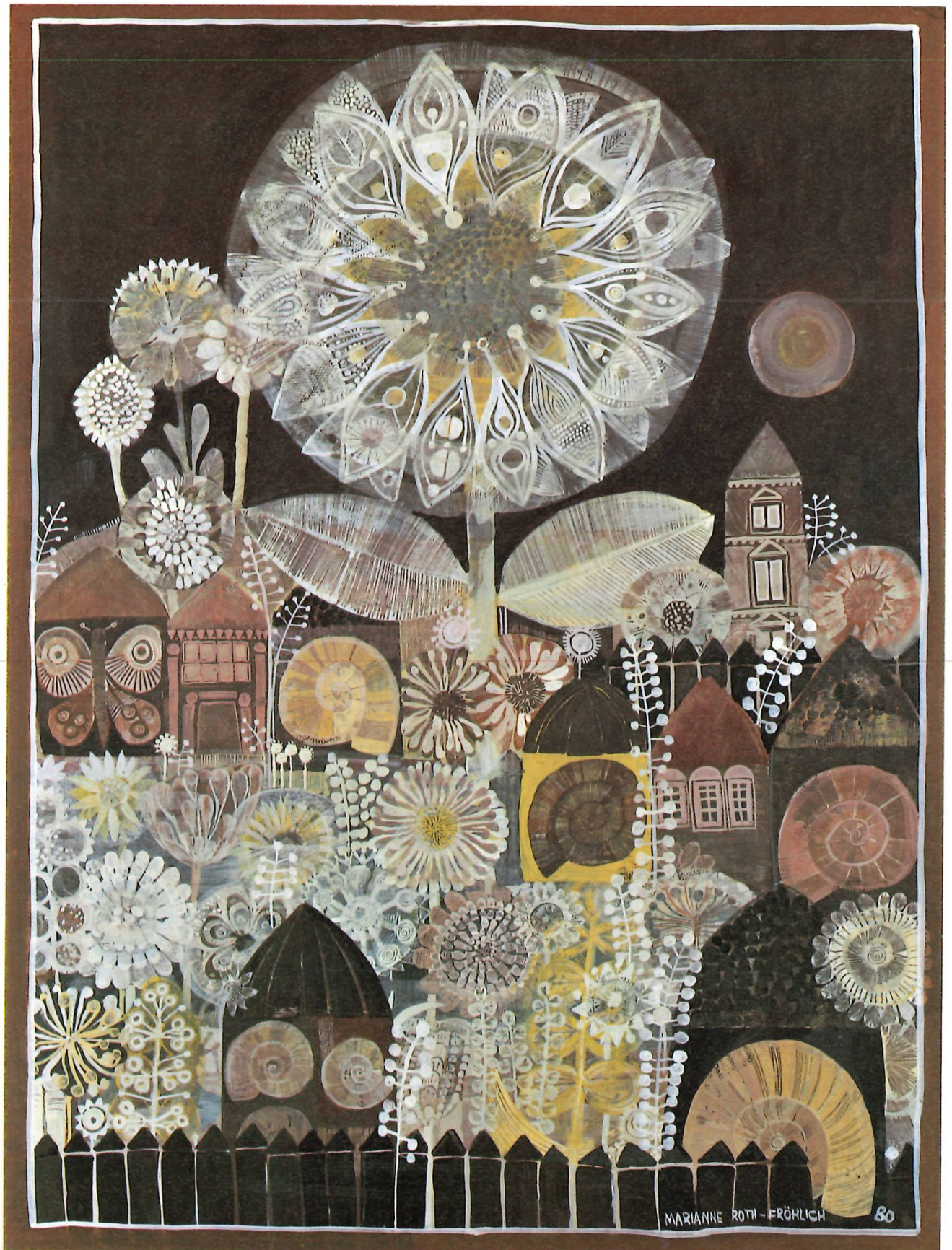
Marianne Roth-Fröhlich, «Ein neuer Frühling», 1980, Eitempera/Mischtechnik, 60x77.