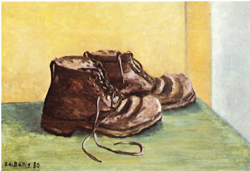
Oben: «Mein Rucksack», 1958, Oel auf Pavatex, 33,5 × 49. «Meine Bergschuhe», 1980, Oel auf Holz, 24 × 34,5. Nebstehend: «Sonnenuntergang bei Meilen», 1980, Oel auf Holz, 23,5 × 34. «Strand von Paguera», Mallorca 1967, Oel auf Pavatex, 42 × 68.