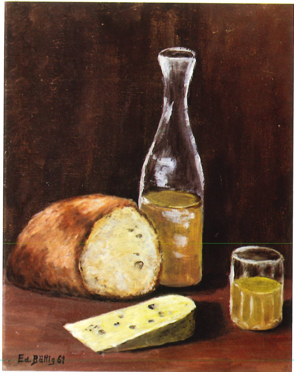
Stilleben, 1961 Öl auf Papatex, 31 × 24,5.