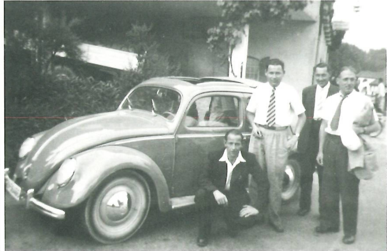
2. Bild rechts: Ausfahrt zum Senioren-Turnier Flawil, 1953.