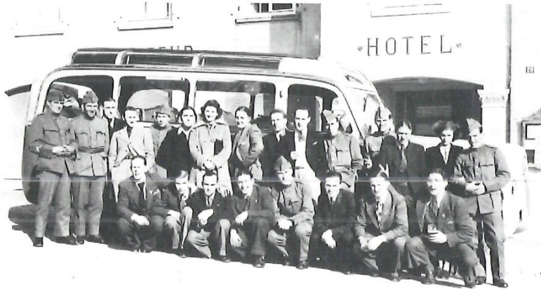
Aktivdienstzeit zwischen 1940 und 1942.