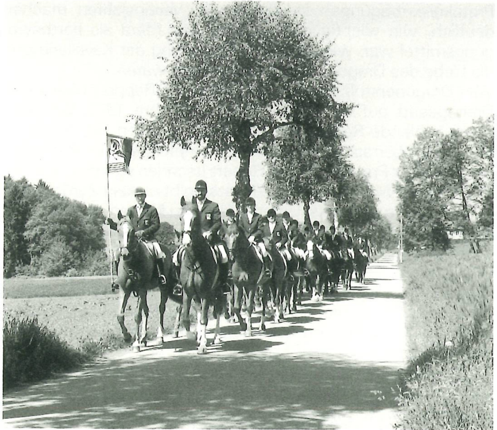
Der Kavallerieverein unterwegs.

mässige Übungen und Ritte voraus. Bei den jährlich fünf bis zehn obligatorischen Tagesritten wurden Strecken zwischen 50 und 80 km zurückgelegt. Regelmässig wurden auch Terrainritte durchgeführt, bei denen die Geländegängigkeit von Pferden und Reitern geübt und gefördert wurde.