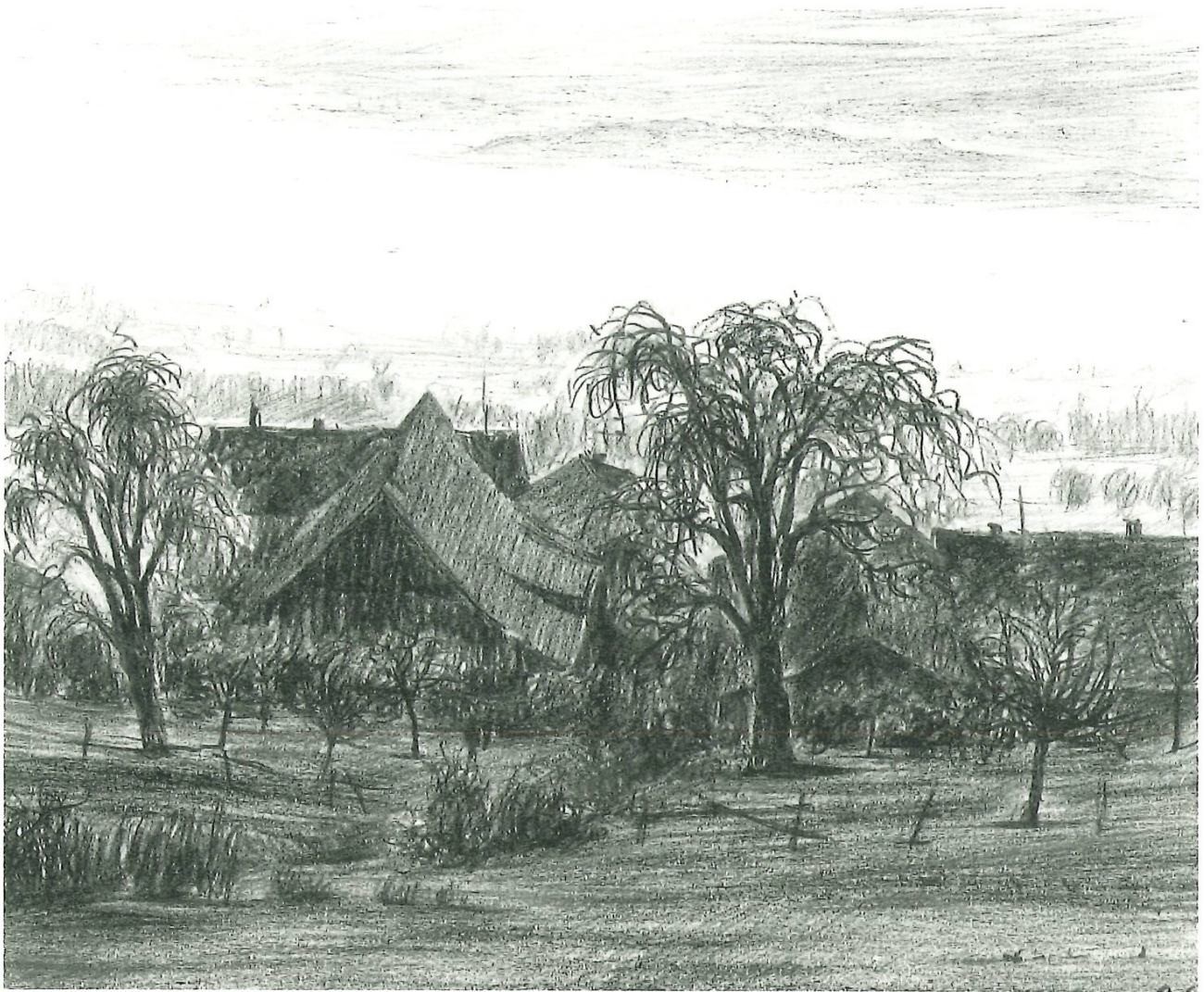
Blick von der Siedlung Hinterer Pfannenstiel auf den Zürichsee. Zeichnung mit braunem Farbstift von Markus Wäspe, 1951.