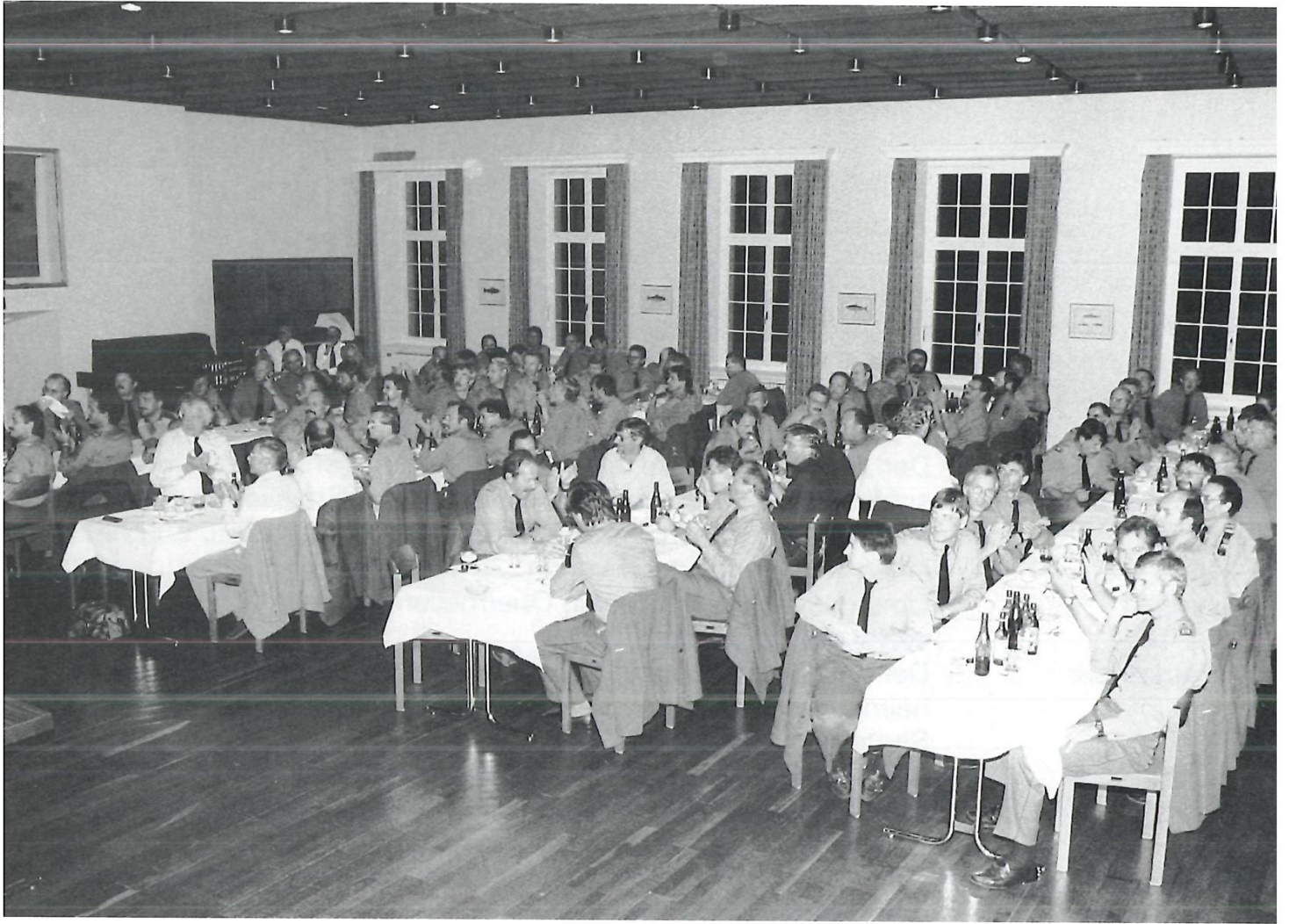
Gemeinsames Nachtessen von Militär- und Zivilschutzentlassenen der Jahrgänge 1944–52 bzw. 1934–42.