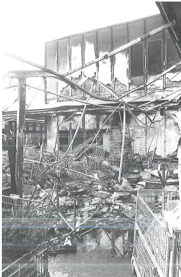
Ein unglaubliches Chaos nach dem Brand auf der Piazza des Einkaufszentrums bei der Migros.