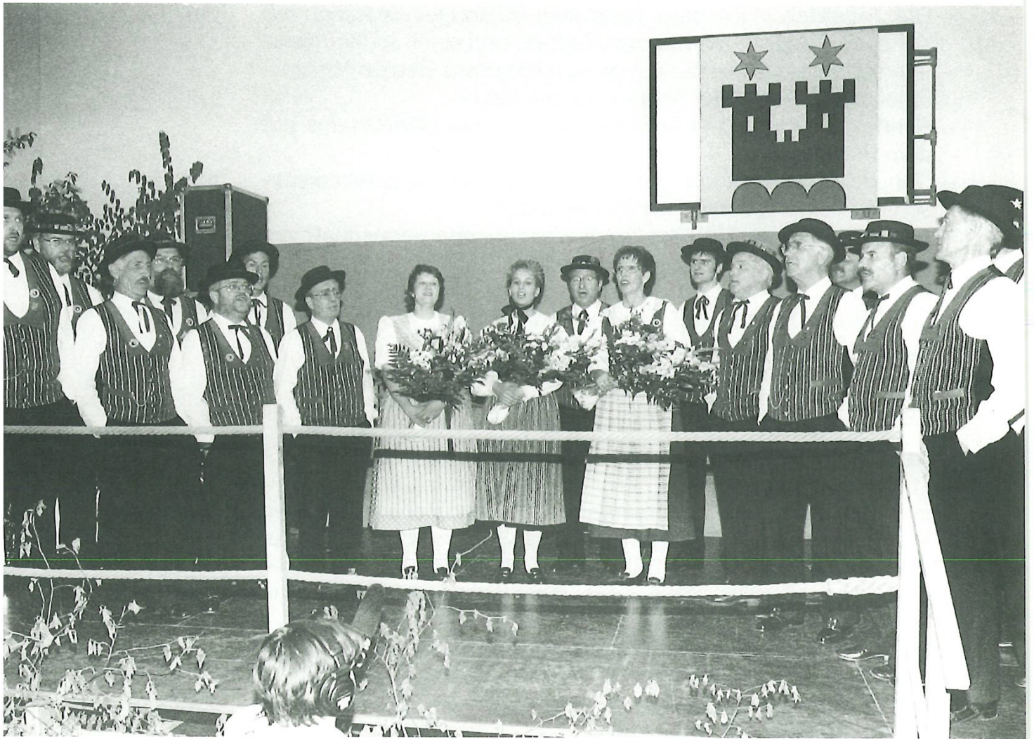
Der Jodelclub «Heimelig», Meilen, beim Festakt zu seinem 50-Jahr-Jubiläum.