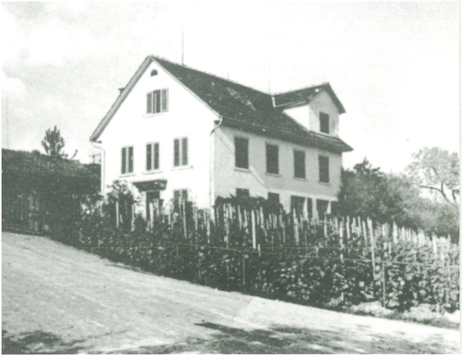
△ Das Schulhaus Bergmeilen an der Toggwilerstrasse, eingeweiht im Jahr 1846, Aufnahme ums Jahr 1894.