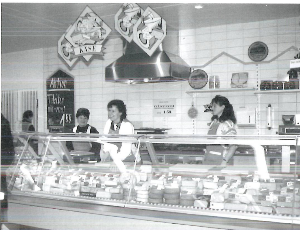
◁ Käseabteilung im Hauptladen.