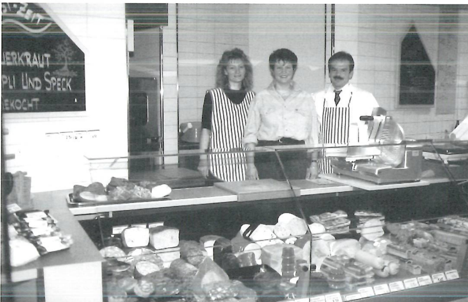
◁ Metzgerei Luminati.