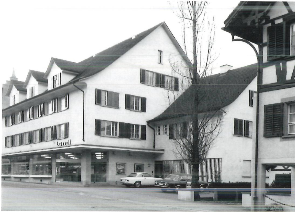
◁ Das Hauptgeschäft an der Dorfstrasse, wie es sich seit 1961 präsentiert.

Lehrtöchter verdienen rasch einen angemessenen Lohn. Ausgebildete Leute, die vorwärtskommen wollen, haben sehr gute Aufstiegsmöglichkeiten. Der Verdienst in der Stellung einer Filialleiterin kann sich sehr wohl mit denjenigen anderer Berufsgruppen vergleichen lassen.