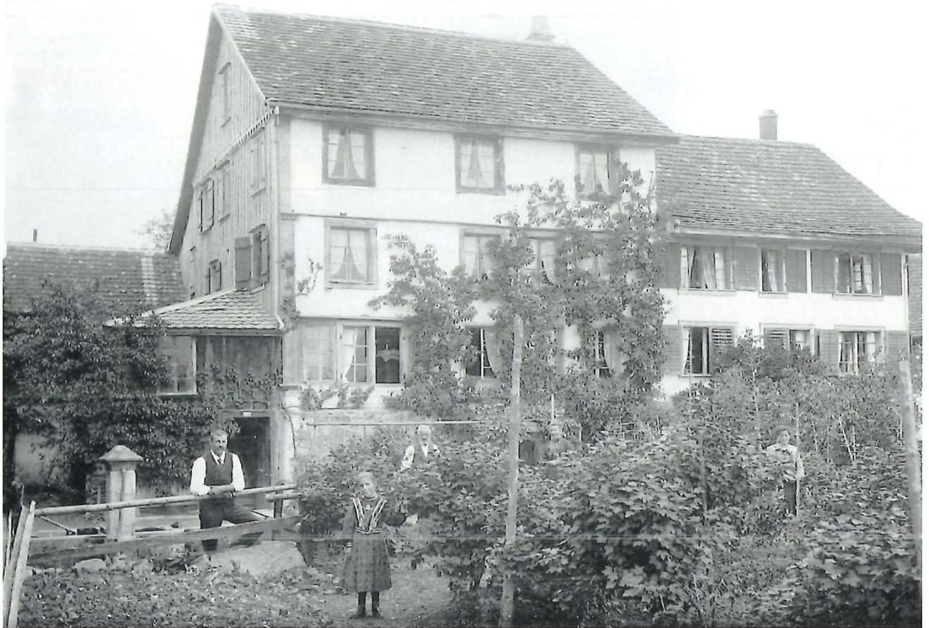
△ Das vor kurzem abgebrochene Haus Egli-Beer, um 1905. ▽ Blick von der Ormis auf das Dorf, Mitte vorn die Pfannenstielstrasse, um 1920.