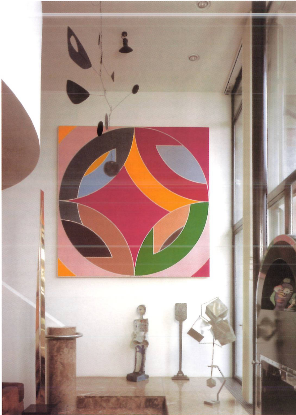
◁ Im Cheminée-Raum. An der Wand das Werk «Flin Flon» von Frank Stella (1970).