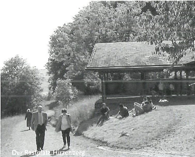
Der Rastplatz Hirzenberg