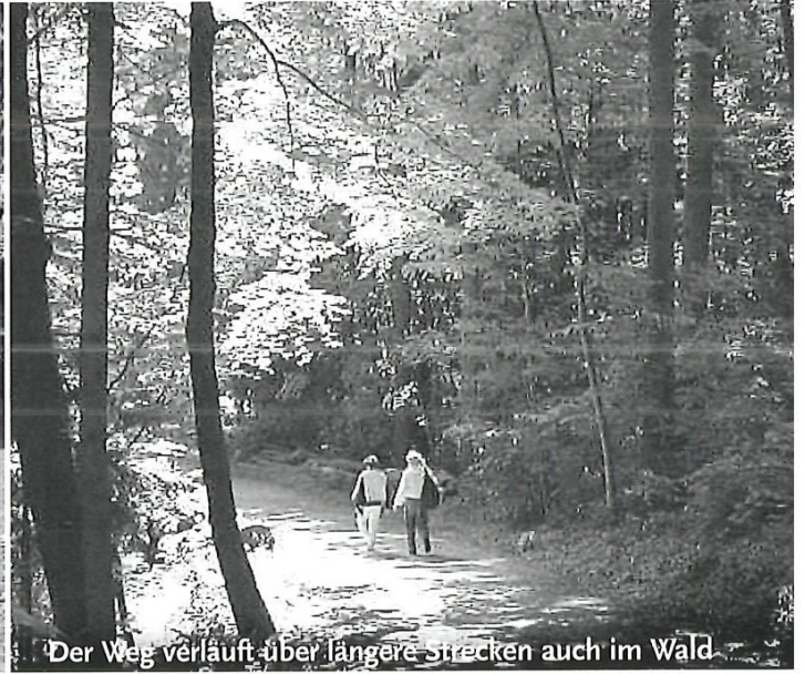
Der Weg verläuft über längere Strecken auch im Wald

1968 die Idee: Ein Aussichtsweg Vorderer Pfannenstiel – Rütihof – Forch Ein Vorstoss des Verkehrs- und Verschönerungs- vereins Meilen (VVM)