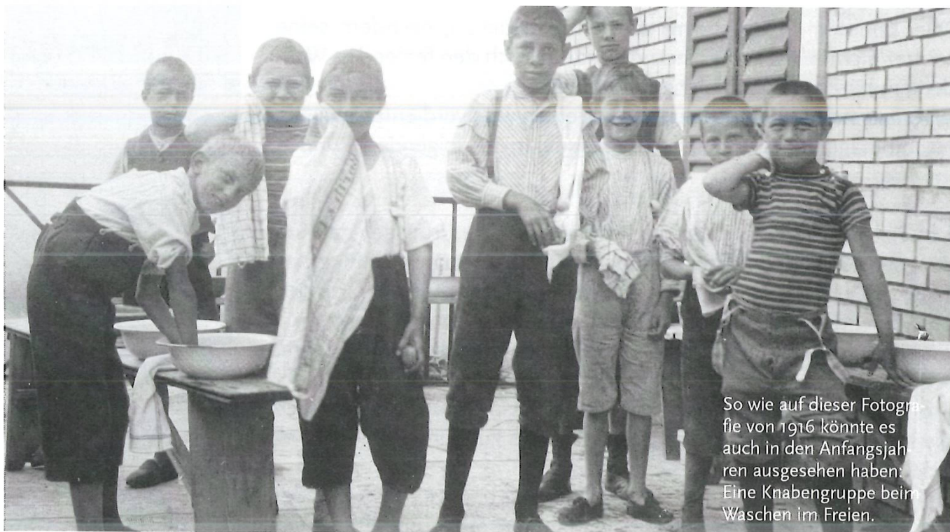
So wie auf dieser Fotografie von 1916 könnte es auch in den Anfangsjahren ausgesehen haben: Eine Knabengruppe beim Waschen im Freien.