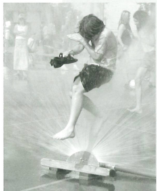
Während der grossen Hitzewelle sorgt die Feuerwehr mit Wasserspielen bei den Schulhäusern für Abkühlung.