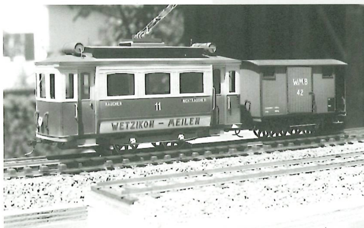
Faszination Eisenbahn im Ortsmuseum: Detailgetreues Modell der Wetzikon-Meilen-Bahn.