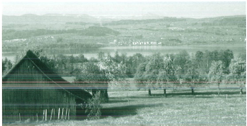
Gleiche Anlage zur Vegetationszeit.