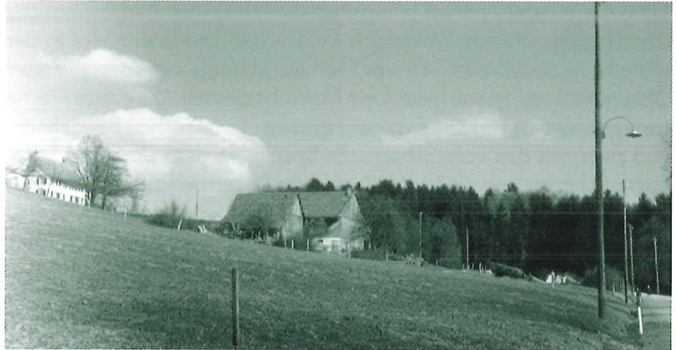
Nach der Baumfällaktion.

1960 begannen die grossen Aktionen des Bundes, die zum Ziel hatten, die alten grossen Bäume auszurotten, da der Mostverkauf zurückgegangen war, weil neue Getränke aufgekommen waren, die sich grösserer Beliebtheit erfreuten als Most. So zahlte der Bund für jeden gefälltten Baum Beiträge aus. Auch auf unserem Betrieb fällten wir in den Jahren 1969/1970 den Grossteil der Obstbäume. Die Mosterei wurde stillgelegt, und das Obst der restlichen Bäume konnte nicht mehr auf dem eigenen Hof verarbeitet werden, sondern wir lieferten die Früchte der Mosterei Kunz (heute Razzai) in Obermeilen. Heute stellen die grossen Obstverwertungsbetriebe aus dem Obstsaft Konzentrat her. So können sie die jährlich schwankenden Mengen des angelieferten Obstes überbrücken. Zudem wird eine grosse Menge Konzentrat mit Subventionen des Bundes exportiert. Ein Teil dieses Konzentrates verarbeitet man auch zu Birnel, dem beliebten Birnendicksaft, der durch die Winterhilfe auch jedes Jahr in Meilen angeboten wird.