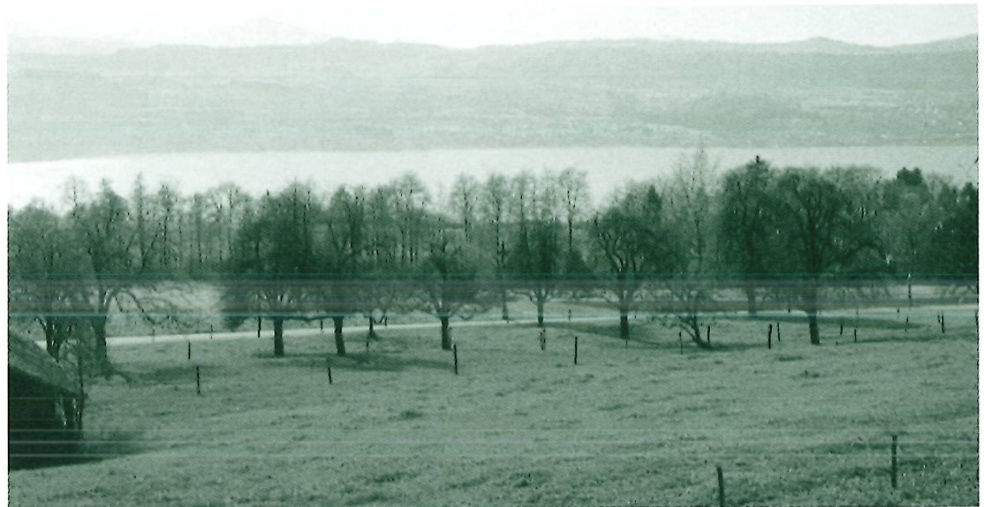
Mostobstanlage mit Hochstammbäumen im Winter, unterhalb Hof Erlen.