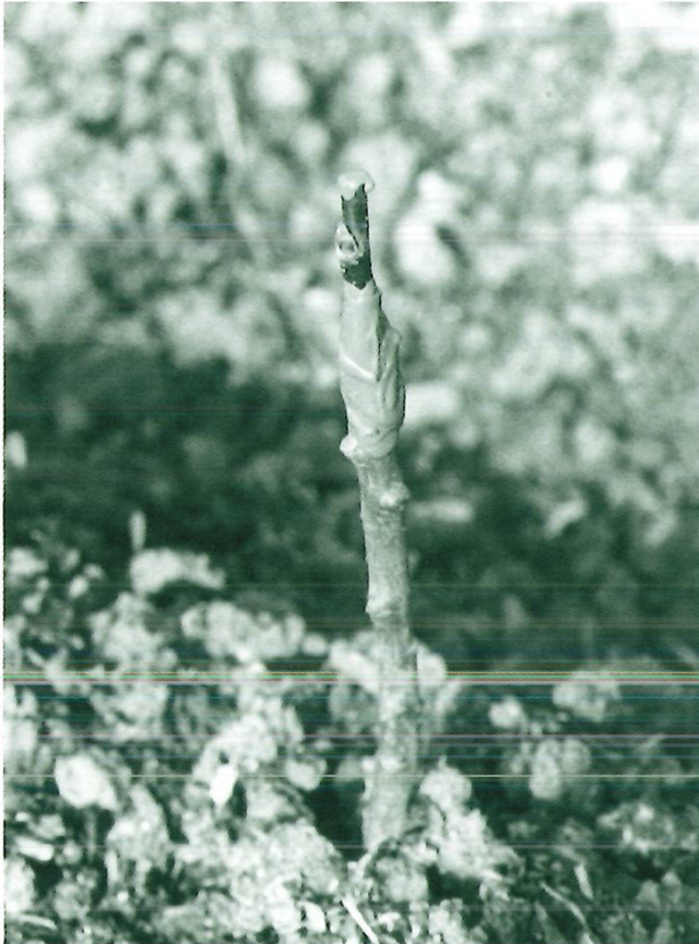
links: Eine Winterhandveredelung, unten Wurzel, oben Edelreiser, kommt in die Baumschule.