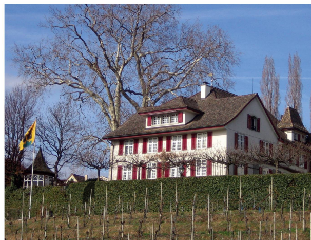
Das Landgut Mariafeld in Feldmeilen

Eine Fülle von Schlüsselwörtern bietet sich zu dieser Frage an. Um die Komplexität zu vereinfachen und zu illustrieren, treffe ich eine Auswahl. Jeder Begriff soll je mit mindestens einem Zitat belegt und mit Inhalt gefüllt werden. Dies geschieht mit Sorgfalt, im Wissen, dass Sätze, die aus ihrem Zusammenhang herausgerissen werden, manipulativ ausgewählt sein können. Jedes Zitat erschliesst zudem ein weites Feld und ist nicht abschliessend. Es ermöglicht aber die eigene Reflexion.