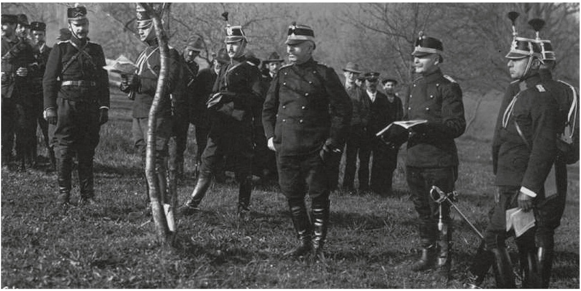
General Wille bei einem Truppenbesuch.

ausgeschlossen, dass jemand im Grossen pflichttreu und zuverlässig sei, wenn er es nicht schon im Kleinen ist.»