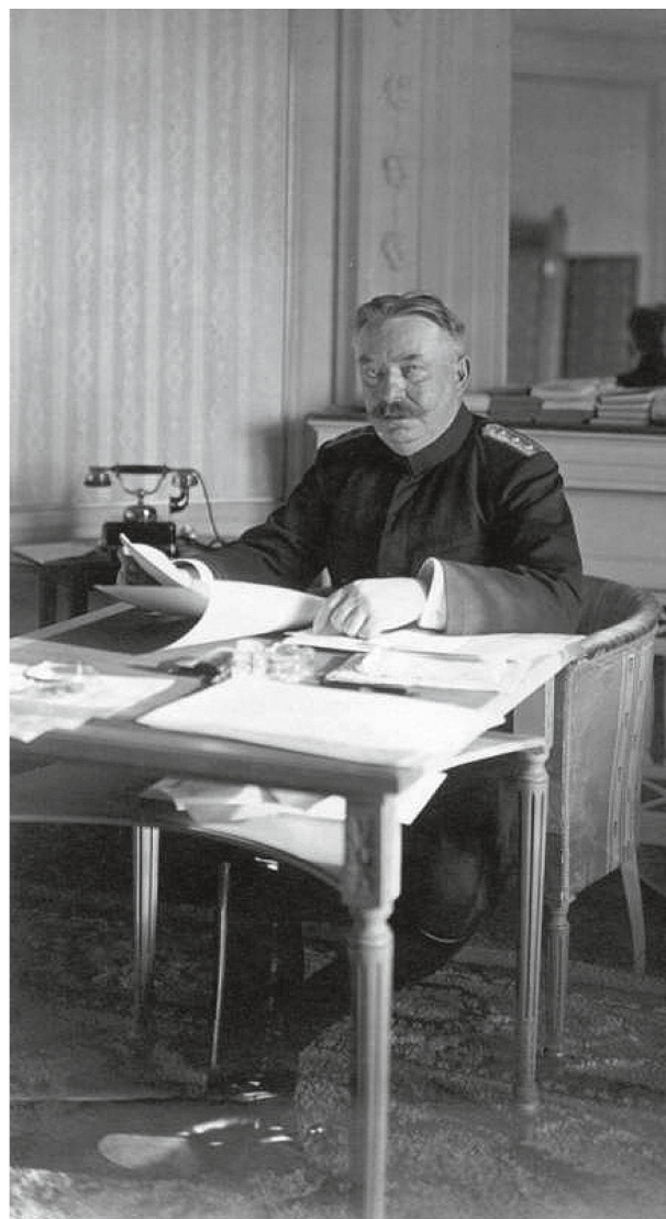
General Ulrich Wille an seinem Arbeitsplatz in Bern.