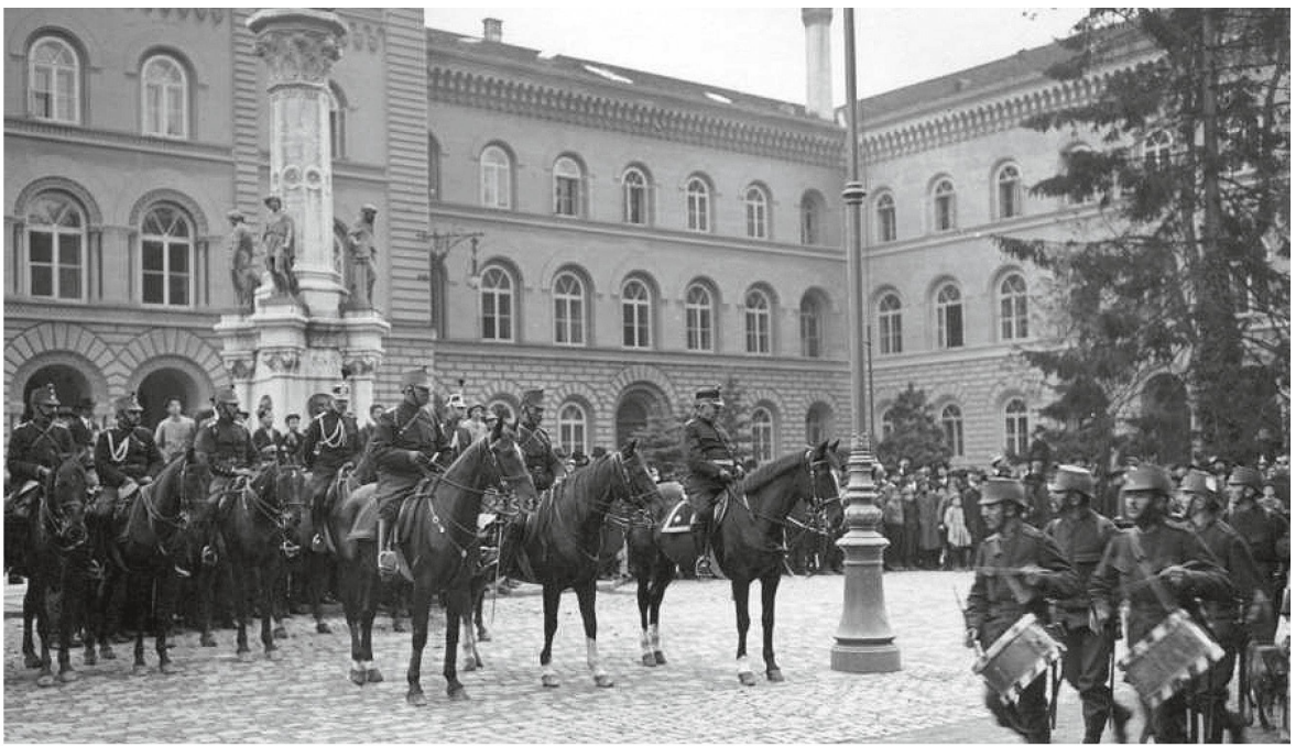
Defilee vor dem Bundeshaus in Bern.

wurde ihnen als zweiter Sohn Konrad Ulrich Sigmund geboren. Ulrich Wille beschreibt 1902 seine Eltern mit grosser Hochachtung: «Er, der kraftvolle, stolze Charakter, der sich vor nichts beugte, aber nachsichtig war für alle Schwächen, sofern keine niedere Gesinnung damit verknüpft, der seinen reichen Geist gleichgültig vergeudete – sie, der überlegene Geist, der mit aller Kraft eines gewaltigen Temperaments und einer nie versagenden Herzensgüte und Selbstlosigkeit, nur auf das Wahre und Gute, auf das Edle im Menschen wirken wollte.» Beide Eltern haben Ulrich Wille geprägt.