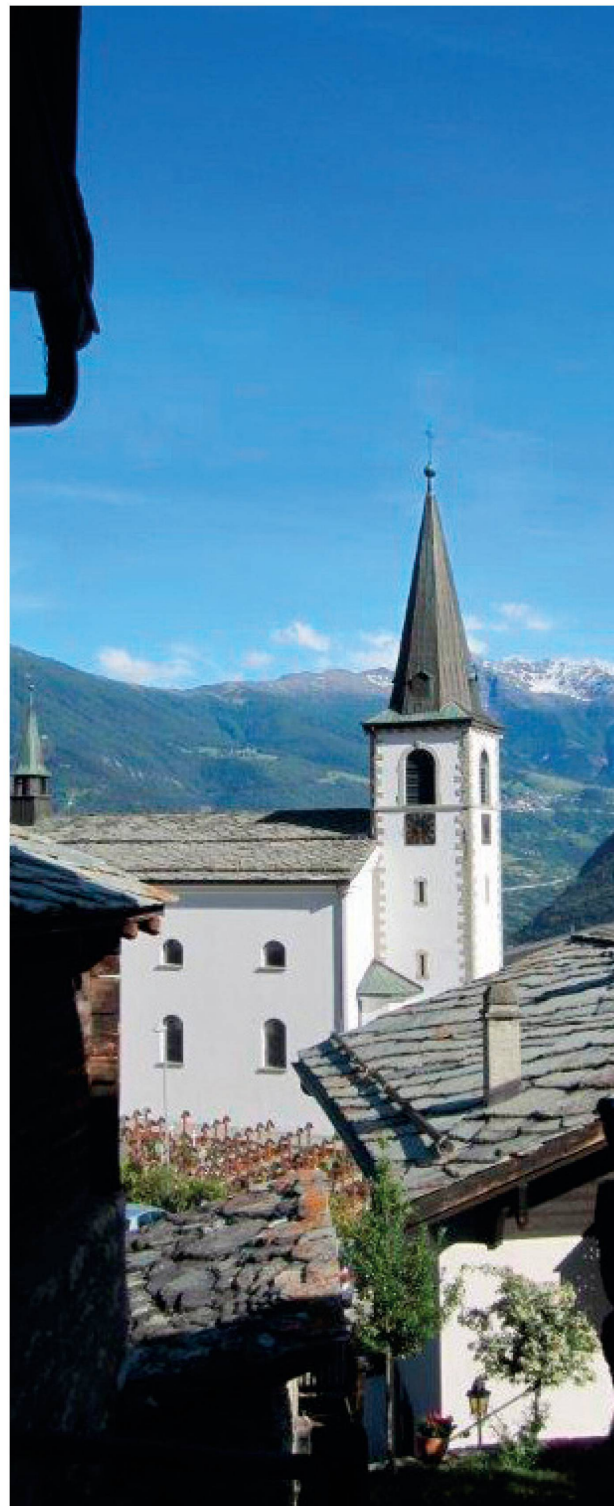
Die Kirche und der Friedhof mitten im Dorf, umringt von Häusern mit Steinplattendächern.

Ausserberg wird auch heute noch von mehreren uralten Familiengeschlechtern bewohnt. Die bedeutendsten Familiennamen sind Heynen, Imboden, Kämpfen, Leiggener, Schmid, Theler und Treyer. Bereits im Jahr 1290 wanderte eine Familie Heynen ins Walsertal aus. Die Leiggener stammen aus der einstigen Gemeinde Leiggern, heute Leukron. Die Theler galten von jeher als un-