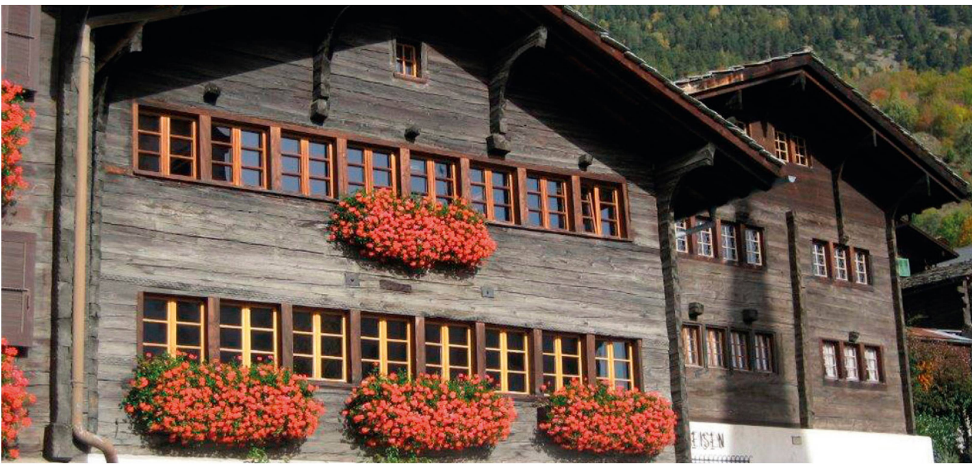
Das Bürger- und Gemeindehaus in Ausserberg wurde 1645 erbaut.

gebaut, bietet unseren Kindern zeitgemässe Räumlichkeiten. Nur die fällige Sanierung des über 60-jährigen Trinkwasser- und Kanalisationsnetzes wie auch der Flurstrassen trübt den fast wolkenlosen Himmel über dem Dorf und den Gemeindeverantwortlichen. Ausserdem beschäftigt uns, wie auch andere Berggemeinden, der Bevölkerungsschwund sehr. Die Abwanderung vornehmlich der jungen Einheimischen wollen wir stoppen. Um unser Dorf weiterzuentwickeln, seine Attraktivität beizubehalten und neue Bewohner zu gewinnen, bedarf es deshalb weiterhin grosser Anstrengungen.