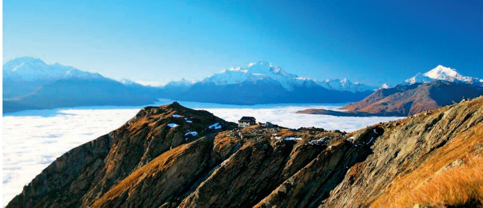
Das atemberaubende Panorama von der Wivannihütte (2463 m) aus.

dig war und ist. Vor allem das Fehlen von Wasser machte den Dorfbewohnern über Jahrhunderte Sorgen. Wiesen, Felder, Gärten und Äcker mussten sie künstlich bewässern, um einen Ertrag zu erhalten und überleben zu können. Doch wie und woher sollte das nötige Wasser genommen werden? Zeitzeugen haben überliefert, wie es im Mittelalter gelungen ist, Wasser aus dem Bietschtal nach Ausserberg zu leiten. Es war ein äusserst gefährliches Unterfangen, und keine noch so steile Felswand, kein Steinschlag konnte sie daran hindern. Mehrere Jahre arbeiteten die Dorfbewohner – mühevoll und oft unter Einsatz ihres Lebens –, um Wässerwasserfuhrn anzulegen. Sie hackten viereckige Löcher, «Toggulecher», in den Fels, um Holzhaken zu befestigen, in welche dann aus Lärchenholz gefertigte «Chänil» eingelassen wurden. Die Wasserleitung erfüllte ihren Zweck, wurde aber dauernd von herabstürzenden Steinen und Lawinen zerstört. Immer wieder mussten die «Chänil» erneuert werden, und immer wieder kamen dabei Menschen ums Leben. Als einmal gleich zwölf Männer am Felsen den Tod fanden, gaben die Ausserberger die westlich gelegene Wässerwassersuon auf. Die Holzchänil wurden nicht mehr repariert.