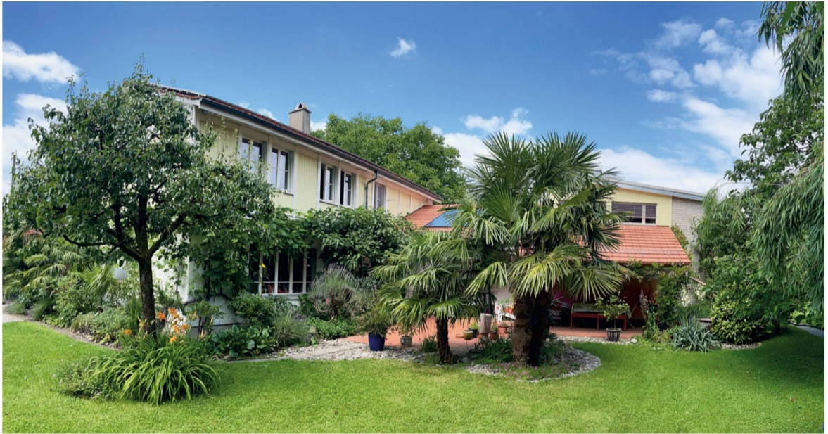
Das Wohnhaus mit Atelier am Tobelweg 26.

wandern. Ihre Eltern hatten immer wieder Gäste im Haus gehabt – unter anderem auch aus Kalifornien. Als Kind habe es sie beeindruckt, dass diese so viel lockerer waren, irgendwie freier als die Menschen, die sie bisher kennengelernt habe. Die Arbeit am Museum war abgeschlossen, der Anstellungsvertrag ihres Mannes abgelaufen, er wollte in den USA eine Ausbildung machen – und so war der Zeitpunkt ideal, um ihren Traum vom Auswandern zu verwirklichen.