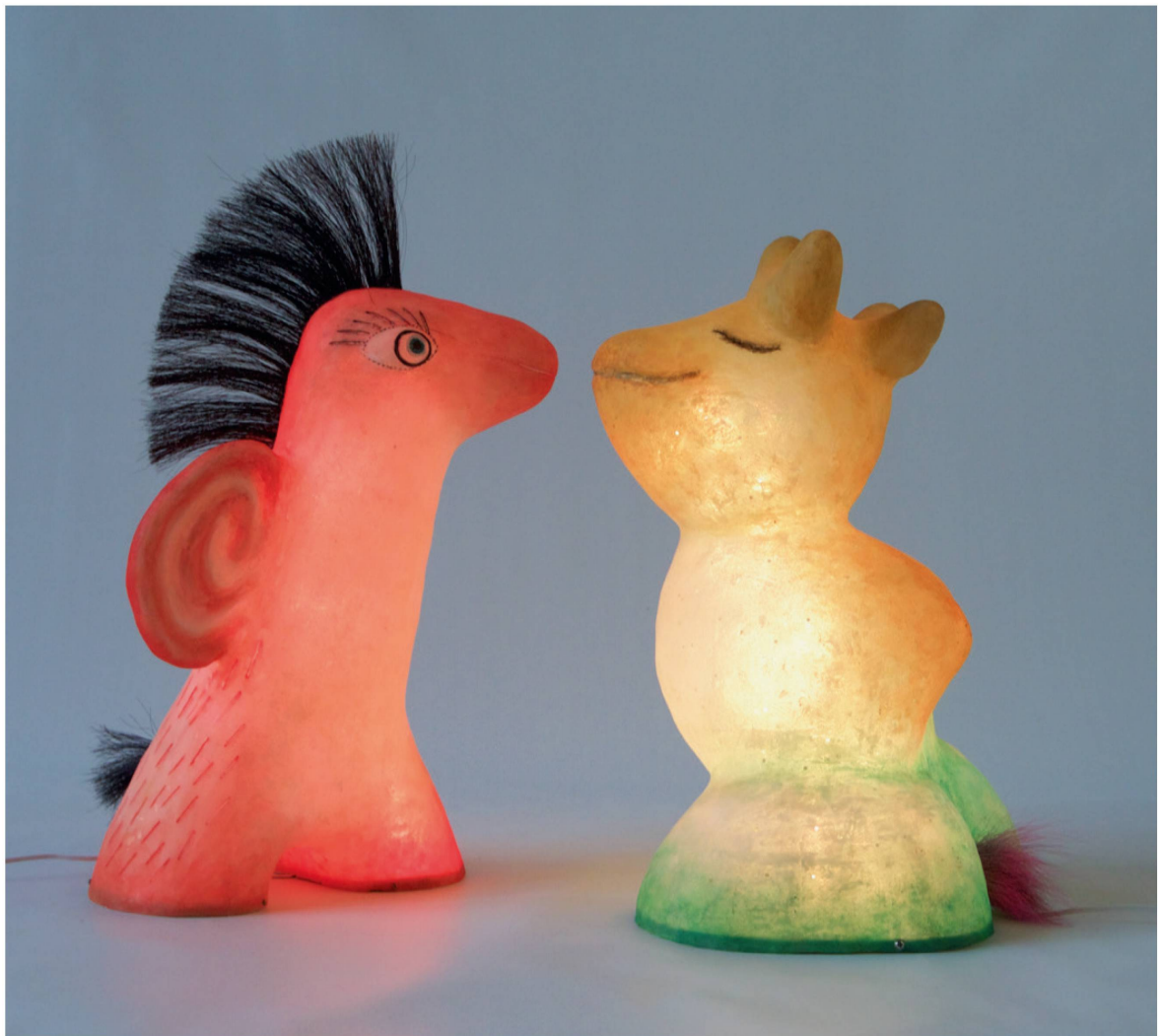
Die Lichtskulpturen «Paar».