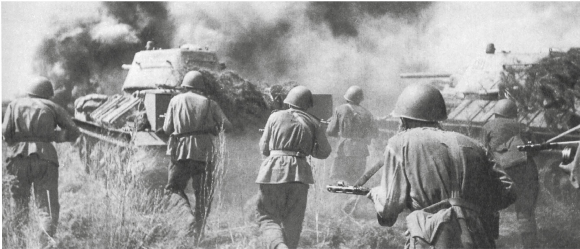
Sowjetische Truppen und Panzer bei einem Gegenangriff in Kursk im Juli 1943.

«[Wir reihen] uns ein in den gewaltigen Heerbann derer, die Europa vor der Gefahr des Bolschewismus retten wollen!»